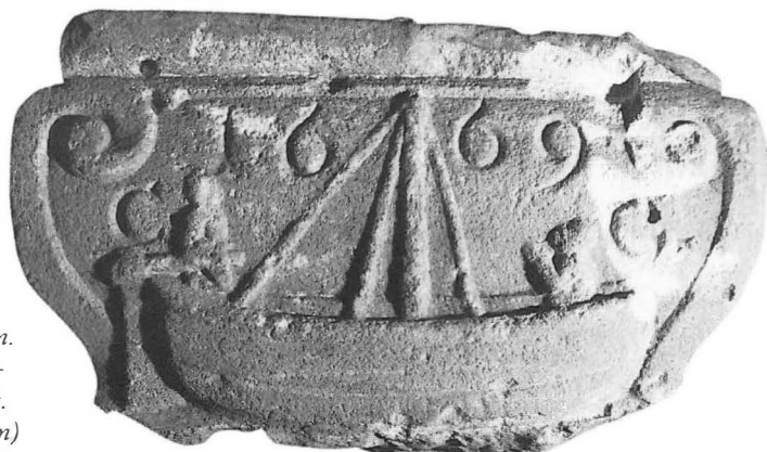
Der Ofenstein aus Hann. Münden mit der Schiffsdarstellung.

Seiner Funktion nach handelt es sich um einen Ofenstein, dessen untere Hälfte nicht mehr vorhanden ist. Ofensteine dienten seit dem 16. Jahrhundert als vordere Stütze unter den würfel- oder quaderförmigen, häufig auch mit Aufsätzen versehenen, aus fünf eisernen Platten bestehenden Öfen, die wegen ihrer Wärmeentwicklung Bodenfreiheit haben mußten (Abb. 2). Sie waren an der rückwärtigen Seite in die Wand eingelassen und wurden vom benachbarten Raum aus befeuert. 1