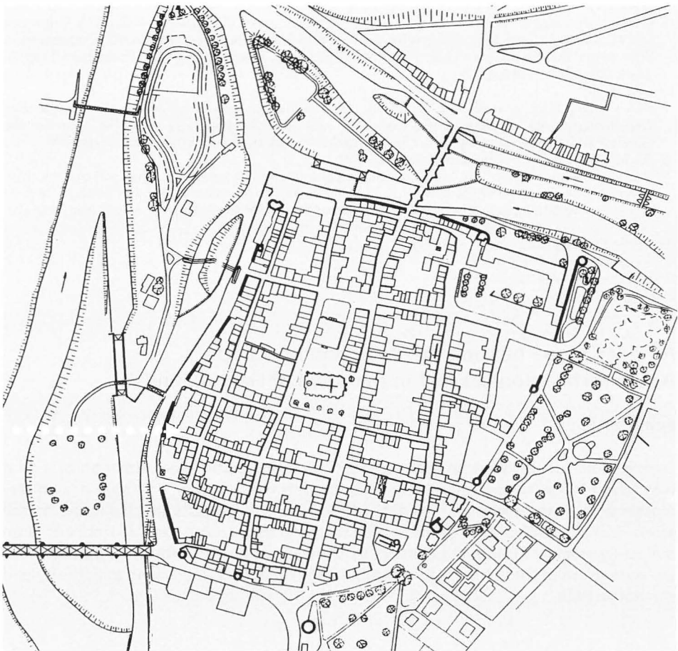
Grundriß des Altstadt-Kerns von Hann. Münden mit Markierung des Hauses, in dem der Stein gefunden wurde.

Mit seiner Lage in der Petersilienstraße im südöstlichen Bereich des Altstadt-kerns (Abb. 3) befindet sich das Haus in jenem Stadtviertel, das für das 17. und das 18. Jahrhundert als bevorzugt von Schiffen und Schiffsknechten bewohnt festgestellt worden ist. Die