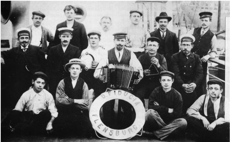
Das Foto zeigt die Mannschaft der FIDUCIA (2), einem Dampfer der Flensburger Reederei Jost. Das Schiff war üblicherweise in der Nord- und Ostseefahrt sowie auf dem Atlantik und im Mittelmeer unterwegs und hatte eine typische Besatzung von 16 Mann. Aufnahme von 1903.

So wird die Aufgabe der Arbeitsvermittlung für Seeleute in einer Hausarbeit der DAV (Deutsche Außenhandels- und Verkehrs-Akademie Bremen) vom vorigen Jahr beschrieben. Interessant daran ist, daß der Bereich der Heuervermittlung heute wieder zunehmend in die Hände von Privatunternehmen, sogenannten Personalleasingunternehmen gelegt wird. Als nicht mehr zeitgemäß beschreibt der Verfasser der oben zitierten Abhandlung die Arbeitsvermittlung für Seeleute durch das Arbeitsamt, eine staatliche Behörde also.