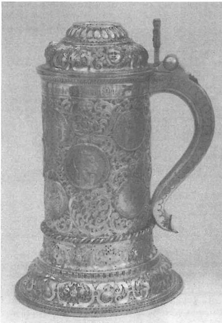
Abb. 3: Silberner Münzhumpen als Regattapreis, gewonnen von der Yacht METEOR (II) 1896.

Zu den in den Wandschränken seiner Yachten ausgestellten Goldschmiedearbeiten hatte er so persönliche Beziehungen, daß er sich auch davon ausgewählte Stücke in sein Exil schicken ließ, bevor die Schiffe verkauft wurden. 7 So blieben diese Objekte zwar in Doorn erhalten; da aber die vorhandenen Unterlagen keine ausreichenden Angaben zu den ursprünglichen Standorten machen, lassen sich die Silberarbeiten aus den Yachten nur dann klar von denen aus den Schlössern trennen, wenn Inschriften auf den Stücken sie als Trophäen der Yachten ausweisen. Das ist der Fall bei folgenden Regattapreisen: