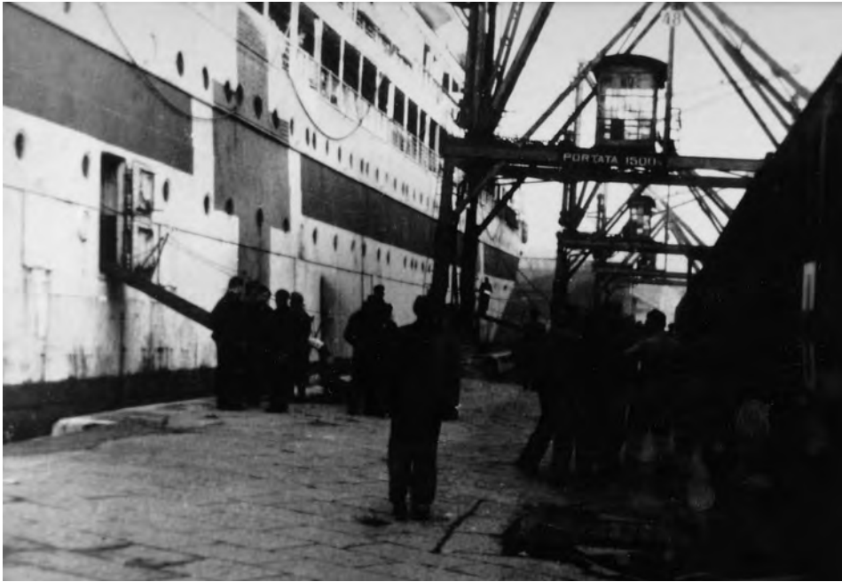
GRADISCA an der Pier in Triest 1944/45.