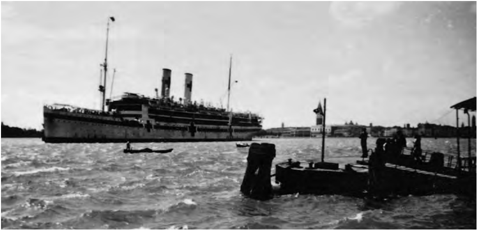
Das Lazarettschiff GRADISCA läuft 1944 aus Venedig aus. Im Hintergrund sind Dogenpalast, Campanile und Rialto-Brücke zu erkennen.

waren die britischen Behörden zu diesem Zeitpunkt noch nicht interessiert. Trotzdem schlug dieser erste Zugriff auf ein deutsches Lazarettschiff durch alliierte Kriegsschiffe einige Wellen, da u.a. auch von der Seekriegsleitung gefragt wurde, weshalb überhaupt britische Gefangene auf dem unsicheren Seeweg in die Adria mitgeführt wurden. Auf jeden Fall mußte die S.K.L. schließlich konstatieren, daß der gegnerischen Seite nach Artikel 12 des Lazarettschiff-Abkommens das Recht zugebilligt werden mußte, die Herausgabe der auf deutschen Lazarettschiffen befindlichen Verwundeten, Kranke und Schiffsbrüchigen zu verlangen, und zwar nicht nur der eigenen Nationalität, sondern durchaus auch der des Feindstaates, ein Umstand, der im darauf folgenden Jahr eine große Aktualität gewinnen sollte.