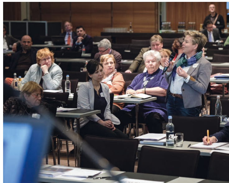
Mit dem Publikum wurden die Konzepte der Sozialraumorientierung diskutiert