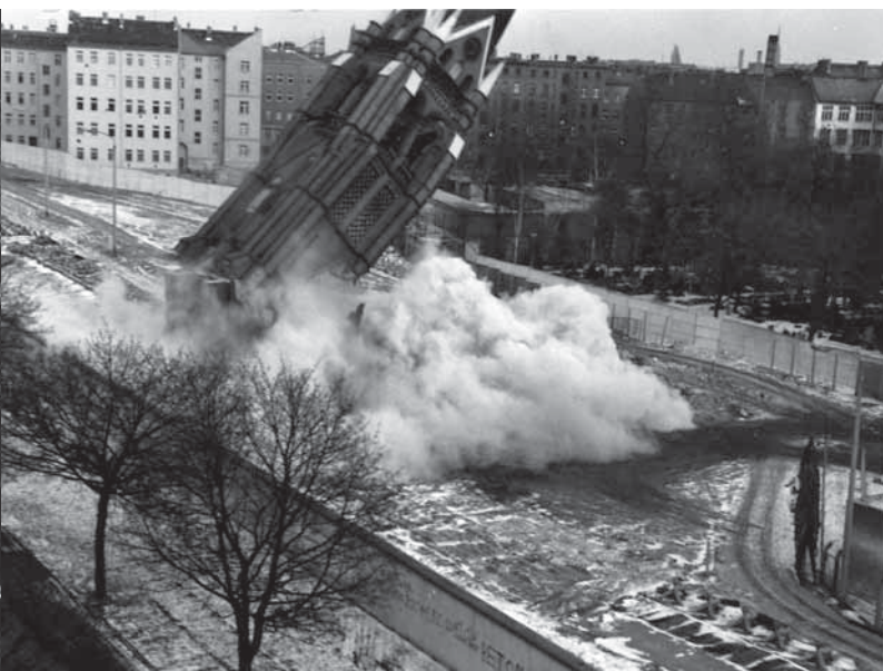
Sprengung der Versöhnungskirche, Januar 1985

der Macher und Gestalter verstehen können und wollen. Das verlangt auch auszuhalten, dass das Angebot verändert, Konzepte modifiziert werden müssen oder etwas, das für sich selber sprechen sollte, »beim Reden« unterstützt werden muss.