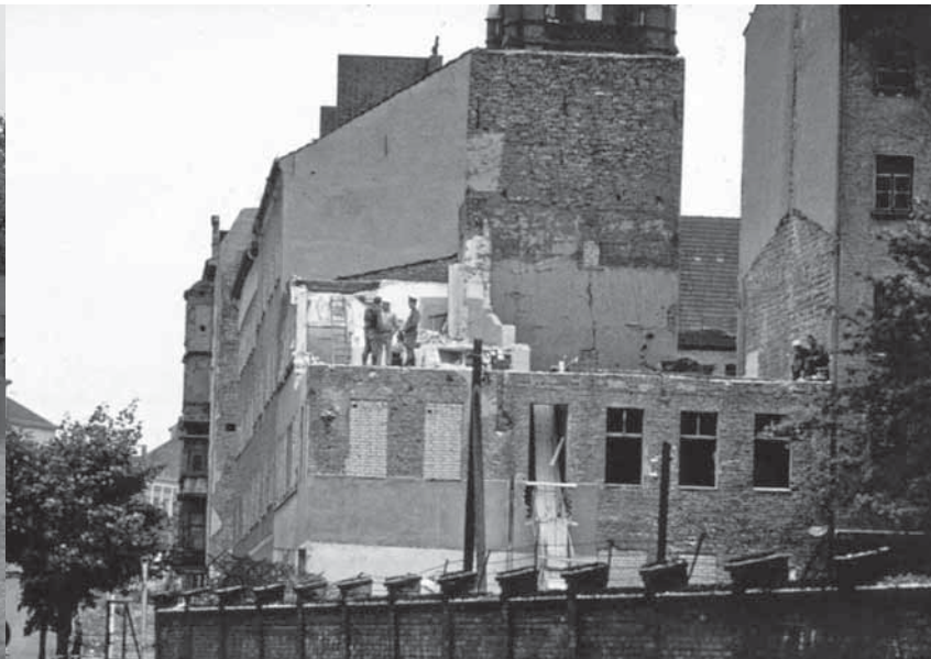
Abriss der Grenzhäuser in der Bernauer Straße 1965

zu bestimmen. Geschichtsunterricht, außerschulische Kinder- und Jugendarbeit, Erwachsenenbildung haben mit der Entwicklung historischer Kompetenzen einen gemeinsamen Bezugspunkt für lebensbegleitendes Lernen. Das Ziel ist, den Menschen als historisches Wesen dabei zu unterstützen, sich in einer Welt, die immer komplexer, vernetzter, interkultureller wird, zu orientieren und seine Identität zu finden, vgl. hierzu auch die Themenhefte Geschichte, z.B. zur Arbeit mit historischen Filmen (Schreiber/Wenzl 2006), mit Zeitzeugen (Schreiber/Arkossy 2009), Gedenkstätten (Körper 2006) oder mit historischem Theater (Lehmann 2006; Körper/Baeck 2006). Worin der Mehrwert eines expliziten Bezugs auf die Geschichtsdidaktik besteht, konkretisiere ich, indem ich zeige, wie an einer außerschulischen Einrichtung, hier der »Gedenkstätte Berliner Mauer«, das Ziel verfolgt werden kann, die Besucher in der Entwicklung