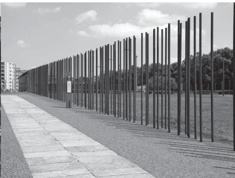
Nachzeichnung der Grenzmauer

onage erfolgen oder die Kategorien Wirtschaft, Gesellschaft, Gender mit den je zugehörigen Konzepten. Die auf den Ort Bernauer Straße bezogenen »Wissenspartikel« (Mauer der ersten, zweiten, dritten Generation; Äußerungen Ulbrichts oder Brandts, Gedächtniskirche, Tunnelfluchten, die Ikone des fliehenden Conrad Schumann, Namen der Opfer der Bernauer Straße, ...) bekommen, abhängig von der leitenden Kategorie, unter die sie gestellt sind, ein je anderes Gewicht und Gesicht.