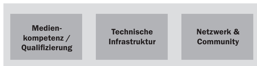
Abb. 1: Struktur des Programms »Neue Medien im Hessencampus«

Technische Infrastruktur: Der Teilbereich »Technische Infrastruktur« widmet sich der Bereitstellung der Plattformen, die für die Umsetzung der medial gestützten Bildungsangebote erforderlich sind. Neben einer hessenweit verfügbaren Lernplattform, auf der die einzelnen Institutionen kostengünstig Lernumgebungen einrichten können, steht auch für den Teilbereich Vernetzung eine technische Infrastruktur bereit. Da gerade die Erstellung digitalen Contents sehr aufwändig ist, sollen Lehrende im Rahmen der Community mithilfe eines »Repositories« Inhalte wie z.B. Arbeitsblätter, Animationen, Quizzes, Lernprogramme und ganze Kurse austauschen können.