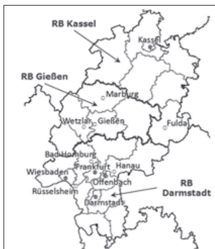
Abb. 1: Regierungsbezirke Hessens

Um das so zusammengesetzte Anbietergefüge nun auf seine Verteilung im geografischen Raum untersuchen zu können, wurde zunächst die in Regionalentwicklungsprogrammen nach wie vor wirksame administrative Einteilung in Regierungsbezirke (RB) zugrunde gelegt. Insgesamt setzt sich Hessen aus den drei Regierungsbezirken Kassel, Gießen und Darmstadt zusammen (s. Abb. 1). Diese Regierungsbezirke unterscheiden sich sowohl sozialstrukturell als auch hinsichtlich ihrer Anbieterzahl erkennbar voneinander. Auf den einwohnerstärksten Regierungsbezirk, Darmstadt, entfällt mit 61 Prozent (n=906) auch ein Großteil der erhobenen Anbieter, während die weniger dicht besiedelten Regierungsbezirke Kassel und Gießen auch eine deutlich geringere Anbieterzahl aufweisen (RB Kassel: 20 %, n=293; RB Gießen: 19 %, n=279).