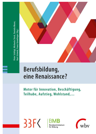
Image und Attraktivität der deutschen Berufsbildung für Studierende in Deutschland