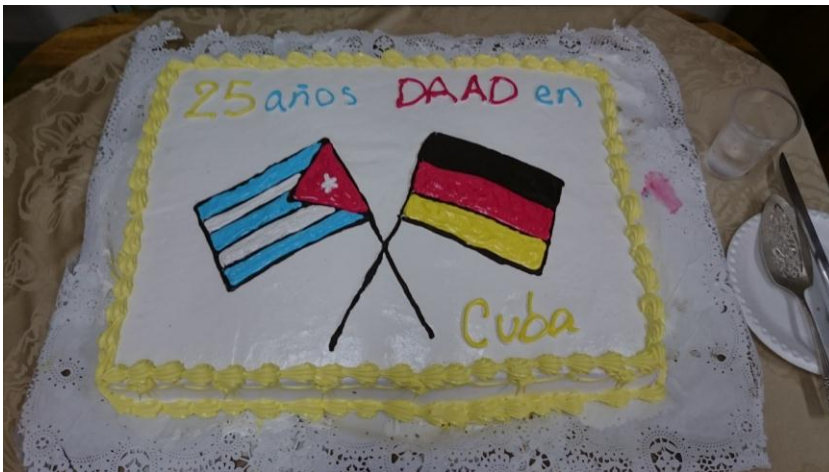
Abb. 13: „25 Jahre DAAD in Kuba“ – Zuckerguss-Torte bei der Jubiläumsfeier

Eine Schlüsselrolle in der deutsch-kubanischen Bildungskooperation kommt dem Deutschen Akademischen Austauschdienst (DAAD), der seit 25 Jahren ununterbrochen auf der Insel präsent ist. Auch als Fidel Castro 2003 jegliche Kooperation mit staatlichen Institutionen der Zusammenarbeit aus EU-Staaten abbrach, konnte der DAAD – wenn auch mit niedrigerem öffentlichen Profil – seine Arbeit auf der Insel fortführen. Gerade dieses kontinuierliche Engagement auch in schwierigen Zeiten gibt dem DAAD heute ein hohes Standing unter kubanischen Wissenschaftlern.