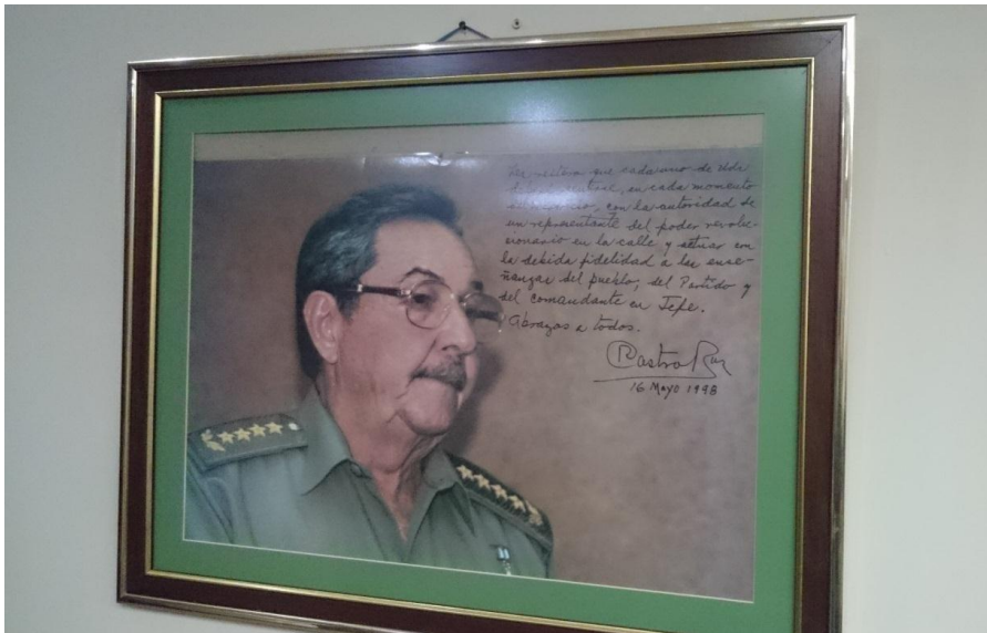
Abb. 1: Foto von Raúl Castro im Rektoratsgebäude der Universität Havanna

In den zehn Jahren Amtszeit Raúl Castros hat sich auch das Verhältnis zwischen Staat und Bürger versachlicht. Dies zeigt sich etwa in der weitgehenden Entmobilisierung der Bevölkerung, die nur noch selten zu Großkundgebungen oder Kampagnen auf die Straße gerufen wird. Der Staat verlangt nach wie vor Loyalität, aber nicht mehr ideologische Begeisterung. Und einer der vielleicht wichtigsten Reformschritte der Ära Raúl war das Migrationsgesetz von 2013, das den Kubanern weitestgehende Reisefreiheit gewährt. In der Folge haben Hunderttausende von Kubanern Reisen ins Ausland unternommen, ob zu Verwandten oder zu Konferenzen, um eine Zeit lang im Ausland zu arbeiten oder um Waren für den Schwarzmarkt ins Land zu bringen.