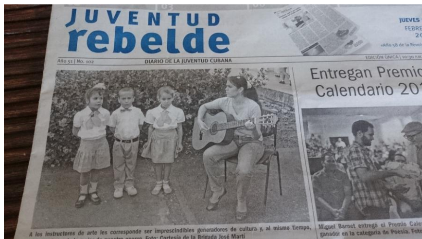
Abb. 12: Text-Bild-Schere in der Zeitung des Kommunistischen Jugendverbands: Sie heißt „Juventud Rebelde“, „Rebellische Jugend“ - das Foto vermittelt jedoch einen wenig rebellischen Eindruck der Jugend...

Fernsehen, Radio und Presse unterstehen dem Monopol von Staat und Partei. Dennoch gibt es einzelne Personen oder Sendungen, die eine Reputation relativer Offenheit erworben haben. Ein Beispiel ist die populäre Comedy-Show „ Vivir del cuento “ im kubanischen Staatsfernsehen, die mit teils bissigem Humor Alltagsnöte und Missstände kommentiert. Im politischen Rampenlicht stand sie, als US-Präsident Obama während seines Besuchs in Havanna auch in einem kurzen Sketch mit ihrem Leitcharakter „ Pánfilo “ auftrat. 24 In Provinzzeitungen sind zum Teil kritischere Töne zu lesen als im Zentralorgan der KP. Immer wieder versuchen Journalisten, den Rahmen des Sag- oder Schreibbaren auszuweiten.