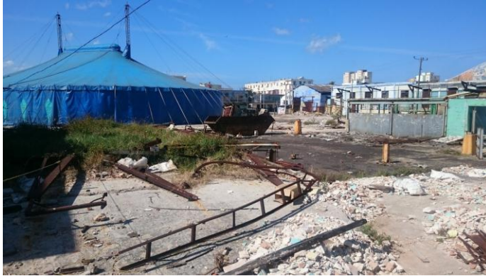
Abb. 10: Zirkuszelt auf Industriebrache in Havanna