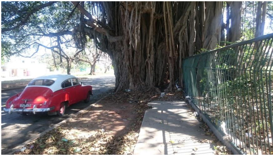
Abb.4: Am Instituto Superior de Arte in Havanna - Die Natur erobert sich den Bürgersteig zurück.

Nicht erst seit der Verbesserung der bilateralen Beziehungen auf Regierungsebene besteht auch ein reger Austausch zwischen deutschen und kubanischen Kunsthochschulen. Ein Beispiel ist die Kooperation zwischen der Burg Giebichenstein Kunsthochschule Halle mit dem Instituto Superior de Arte (ISA) in Havanna, die seit Jahren sowohl Dozenten- wie Studentenaustausch organisiert. Angesichts des großen Interesses von Studierenden wie Hochschullehrern auf beiden Seiten sind derartige Kooperationen zwischen Deutschland und Kuba zweifelsohne weiter ausbaubar.