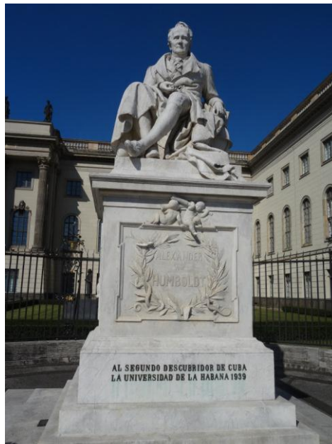
Abb. 2: Humboldt-Denkmal in Berlin mit von der Universität Havanna gestifteten Inschrift: „Dem Zweiten Entdecker Kubas“

Wenn Deutschland und Kuba gegenwärtig über ein Kulturabkommen verhandeln, dann sind die Erwartungen hoch. Denn die deutsch-kubanischen Kultur- und Bildungsbeziehungen haben eine lange Tradition, die nicht zuletzt auf den historischen Aufenthalt Alexander von Humboldts in Kuba in den Jahren 1801 und 1804 zurückgeht. Auf Grund seiner frühen wissenschaftlichen Arbeiten zur Insel wird er in Kuba oft auch als ‚Zweiter Entdecker Kubas‘ bezeichnet. Dies ist übrigens auch in Berlin zu sehen. Die Universität Havanna brachte bereits 1939 an seinem Denkmal vor der Humboldt-Universität die Inschrift an: „Al Segundo Descubridor de Cuba. La Universidad de La Habana 1939“ .