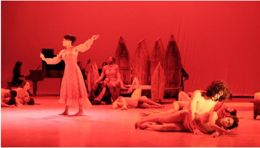
Abb. 3: Szene aus dem kubanischen Tannhäuser . Im Bühnenbild die Holzboote des kubanischen Künstlers Kcho.