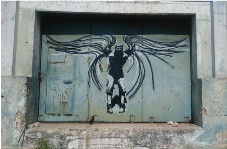
Abb. 8: Street Art in der Nähe der Fábrica de Arte Cubano in Vedado, Havanna

Angesichts des kommerziellen Erfolgs von Kubas Bildender Kunst stellen manche die Frage, inwieweit hier für die kulturelle Zusammenarbeit noch die Notwendigkeit spezieller Förderung besteht. Im Bereich Street Art ist dies mit Sicherheit der Fall. Gerade internationale Projekte können, wie die Kunst-Biennale zeigt, hier wichtigen Rückhalt und Impulse geben. Die Aufnahme von Austausch und Kooperation in diesem Bereich durch die deutsche Auswärtige Kulturpolitik kann dies auch jenseits der ‚Ausnahmesituation Biennale‘ befördern. Auf die Agenda gesetzt werden können deutsch-kubanische Co-Produktionen in Kuba selbst wie in Deutschland, beispielsweise im Rahmen der 40° Urban Art Düsseldorf oder anderer Projekte. Aber auch Ausstellungen zur Street Art können in beide Richtungen dem Publikum unerwartete Perspektiven auf das jeweils andere Land bieten. In besonderem Maße eignet sich der Bereich Street Art zudem für Dreiecks-Kooperationen mit Lateinamerika, wo sich in vielen Städten seit Jahren eine breit gefächerte Street Art-Szene entwickelt. Neben konkreten Kunstprojekten wäre es da auch denkbar, deutsche, kubanische und lateinamerikanische Künstler zu Foren über die Rahmenbedingungen dieser Kunst im öffentlichen Raum – von den unterschiedlichen materiellen Voraussetzungen bis hin zu den Erfahrungen mit Ansätzen neuer Toleranz und Förderung durch die Stadtverwaltungen etwa in Bogota oder Rio de Janeiro.