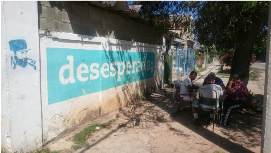
Abb. 7: Im Rahmen der 12. Kunst-Biennale entstandene Street Art in Havannas Stadtteil Romerillo

Jenseits der Kunst-Biennale gibt es eine Reihe von Street Art-Projekten, die in Verbindung mit lokalen Kulturprojekten entstanden sind oder sich zu solchen entwickelt haben. José Fusters an Gaudí erinnernde Arbeiten mit Keramik und Kacheln in Jaimanitas, im Westen Havannas, oder der afro-karibisch geprägte Callejón de Hamel sind dabei längst Touristenattraktionen. Aber auch jenseits des touristischen Rampenlichts entsteht Straßenkunst in Gemeindezentren, wie Vladimir González' Projekt „100 Metros a la redonda“ im Stadtteil Cerro oder das „ Trazos Libres “-Projekt von Hermes Martínez in Cienfuegos an der Südküste der Insel.