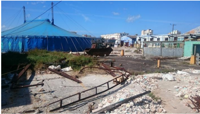
Abb. 10: Zirkuszelt auf Industriebrache in Havanna