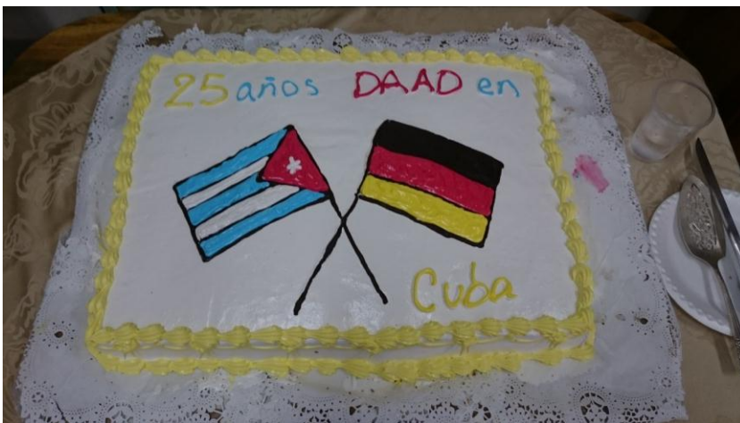
Abb. 13: „25 Jahre DAAD in Kuba“ – Zuckerguss-Torte bei der Jubiläumsfeier

Eine Schlüsselrolle in der deutsch-kubanischen Bildungskooperation kommt dem Deutschen Akademischen Austauschdienst (DAAD), der seit 25 Jahren ununterbrochen auf der Insel präsent ist. Auch als Fidel Castro 2003 jegliche Kooperation mit staatlichen Institutionen der Zusammenarbeit aus EU-Staaten abbrach, konnte der DAAD – wenn auch mit niedrigerem öffentlichen Profil – seine Arbeit auf der Insel fortführen. Gerade dieses kontinuierliche Engagement auch in schwierigen Zeiten gibt dem DAAD heute ein hohes Standing unter kubanischen Wissenschaftlern.