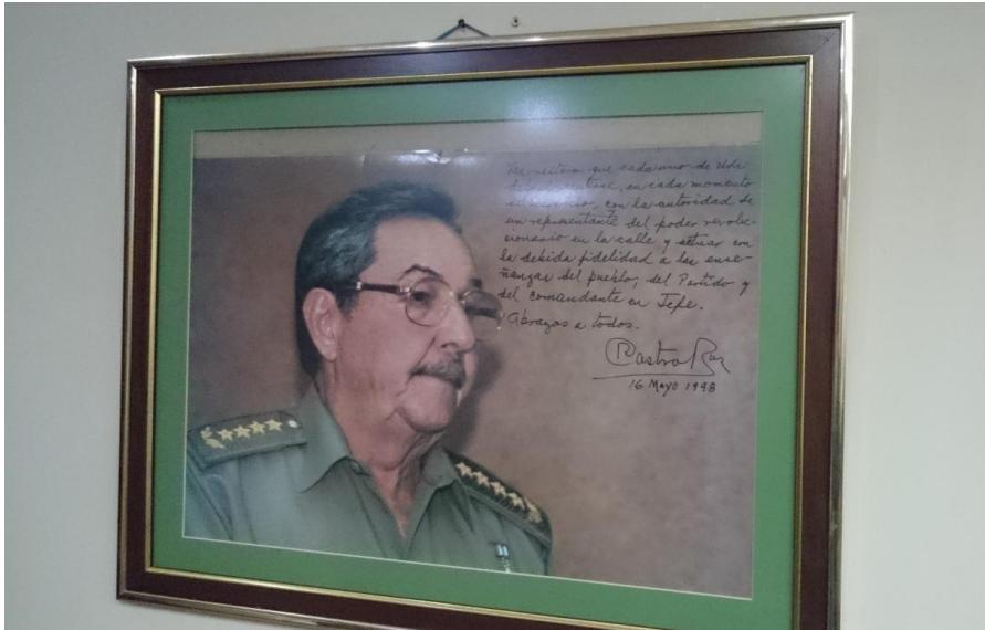
Abb. 1: Foto von Raúl Castro im Rektoratsgebäude der Universität Havanna

In den zehn Jahren Amtszeit Raúl Castros hat sich auch das Verhältnis zwischen Staat und Bürger versachlicht. Dies zeigt sich etwa in der weitgehenden Entmobilisierung der Bevölkerung, die nur noch selten zu Großkundgebungen oder Kampagnen auf die Straße gerufen wird. Der Staat verlangt nach wie vor Loyalität, aber nicht mehr ideologische Begeisterung. Und einer der vielleicht wichtigsten Reformschritte der Ära Raúl war das Migrationsgesetz von 2013, das den Kubanern weitestgehende Reisefreiheit gewährt. In der Folge haben Hunderttausende von Kubanern Reisen ins Ausland unternommen, ob zu Verwandten oder zu Konferenzen, um eine Zeit lang im Ausland zu arbeiten oder um Waren für den Schwarzmarkt ins Land zu bringen.