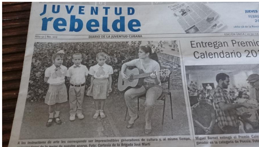
Abb. 12: Text-Bild-Schere in der Zeitung des Kommunistischen Jugendverbands: Sie heißt „Juventud Rebelde“, „Rebellische Jugend“ - das Foto vermittelt jedoch einen wenig rebellischen Eindruck der Jugend...

Fernsehen, Radio und Presse unterstehen dem Monopol von Staat und Partei. Dennoch gibt es einzelne Personen oder Sendungen, die eine Reputation relativer Offenheit erworben haben. Ein Beispiel ist die populäre Comedy-Show „ Vivir del cuento “ im kubanischen Staatsfernsehen, die mit teils bissigem Humor Alltagsnöte und Missstände kommentiert. Im politischen Rampenlicht stand sie, als US-Präsident Obama während seines Besuchs in Havanna auch in einem kurzen Sketch mit ihrem Leitcharakter „ Pánfilo “ auftrat. 24 In Provinzzeitungen sind zum Teil kritischere Töne zu lesen als im Zentralorgan der KP. Immer wieder versuchen Journalisten, den Rahmen des Sag- oder Schreibbaren auszuweiten.