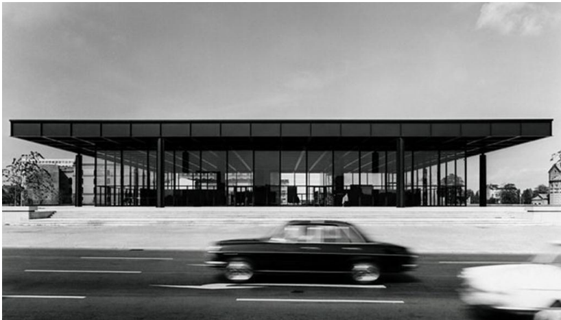
Abb. 11: Mies van der Rohe (1968), Neue Nationalgalerie, Berlin

Die von Mies van der Rohe entworfene Neue Nationalgalerie, 1968 im Zentrum West-Berlins erbaut, ist eine Ikone der Klassischen Moderne. Ein geradezu didaktisches Meisterstück, das zeigt, was die neuen Bautechniken möglich machten: die Außenwände vollständig aus Glas, jeglicher tragender Funktion entbunden und maximale Transparenz schaffend. Der stützenfreie Innenraum. Das tonnenschwere Flachdach, das lediglich auf acht außerhalb des Gebäudes stehenden, schlanken Metallpfählen ruht. Eine Feier von Geometrie und Statik.