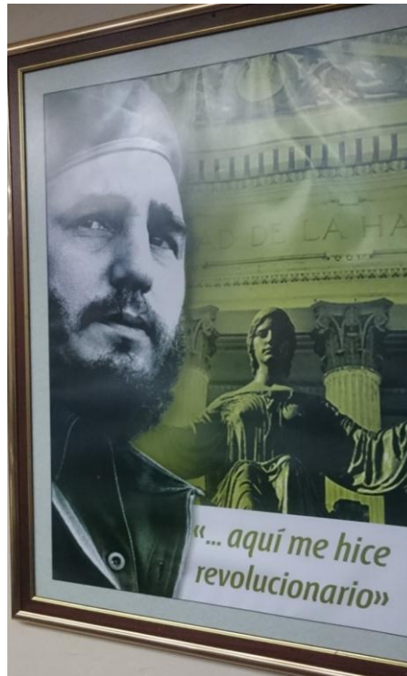
Abb. 14: „Hier bin ich zum Revolutionär geworden“ – Bild im Rektorat der Universität Havanna

Kubas Hochschulsektor verfügt über einen professionellen Verwaltungsapparat. Gleichwohl können bürokratische Probleme zeit- und energieraubend sein. Dies reicht von Visa- und Statusfragen bis hin zu Einschränkungen für die Vergabe eingeworbener Projektmittel vor Ort. Hinzu kommt, dass durch die Verbesserung der Beziehungen Kubas zu den europäischen Staaten und insbesondere durch die Annäherung an die USA die Hochschuleinrichtungen der Insel teilweise einen regelrechten Ansturm an Kooperationsofferten erleben. Die notwendigen Strukturen, um die internationalen Kooperationsangebote auf gleichbleibend hohem Niveau umzusetzen, wachsen jedoch nicht in gleichem Maße mit. Die ‚Absorptionskapazität‘ des kubanischen Wissenschaftssystems ist nicht unbegrenzt und in manchen Bereichen droht Überdehnung.