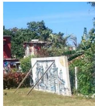
Abb. 5 und 6: Im Rahmen der 12. Kunst-Biennale entstandene Street Art in Havannas Stadtteil Romerillo