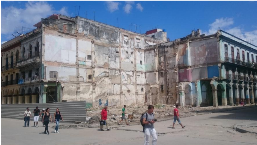
Abb. 9: Eingestürzte Altbauten im Zentrum von Havanna

Infolge der aktuellen wirtschaftlichen und sozialen Veränderungen erleben Kubas Städte einen Strukturwandel, auf den sie kaum vorbereitet sind. Die Öffnung für Marktmechanismen sowie der sprunghafte Anstieg des Tourismus insbesondere durch die Annäherung an die USA bringen weitreichende Änderungen der urbanen Nutzung mit sich. Neue Verkaufsstände für privates Gewerbe verändern das Straßenbild. Auch die soziale Polarisierung der Gesellschaft wird sichtbar. Einzelne Gebäude oder Wohnungen werden teils aufwändig renoviert, um als Restaurants oder Bed and Breakfasts für Touristen genutzt zu werden, während parallel dazu – oft in unmittelbarer Nachbarschaft – der Verfall der Bausubstanz ungebremst weitergeht.