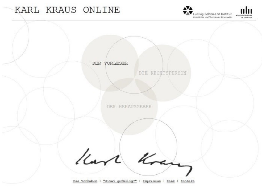
Abbildung 1: Karl Kraus Online – Startseite