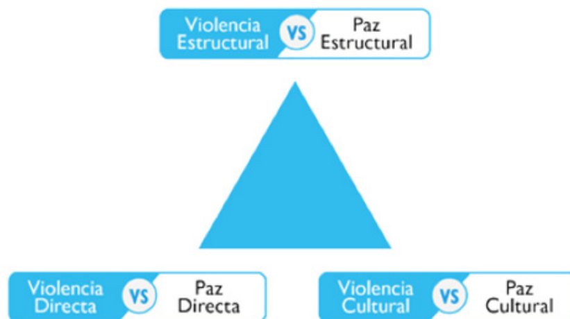
Gráfico 1. Dimensiones de la Paz Positiva

Fuente: Ramos 2015: 36, a partir de Galtung (1985) & Tuvilla (2004)