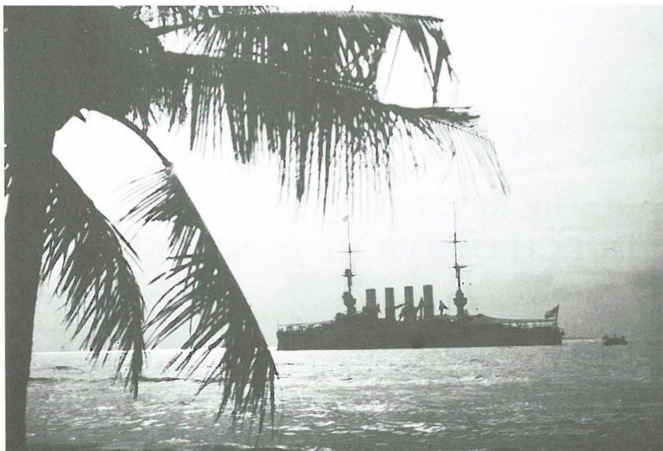
SMS SCHARNHORST im Hafen von Makassar, Sulawesi (Celebes).

Papeete hatte informieren können, wollte versuchen, dort seine Vorräte an Kohlen, Wasser und Proviant aufzufüllen. Frühmorgens am 22. September erschienen die Schiffe vor der Hafeneinfahrt. Über die weiteren Ereignisse hat der amerikanische Konsul Mr. Goodsire am nächsten Tag seiner Regierung in Washington einen Bericht gesandt, der in sinngetreuer Übersetzung folgendermaßen lautet: