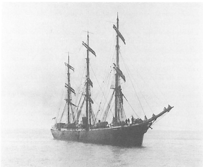
Abb. 1 Vollschiff TONAWANDA ex INDRA.

dürftige Informationen von einem anderen Schiff, dem sie zufällig begegneten. In einigen Fällen konnte ein Kapitän aufgrund solcher Informationen den Kurs ändern und einen neutralen Hafen erreichen. Ein Beispiel dafür liefert das Vollschiff INDRA, das im Oktober 1914 mit einer Salpeterladung das Seegebiet vor dem Ärmelkanal erreichte und erst dort von anderen Schiffen vage Nachrichten von einem Krieg erhielt. Als der Kapitän abends den suchenden Scheinwerferstrahl eines Kriegsschiffes sah, ging er kurzentschlossen auf NW-lichen Kurs und segelte sein Schiff in einer strapaziösen Reise nach New York, das er am 8. November nach einer 150tägigen Fahrt von Chile erreichte. Die INDRA lag dort gut bis zum April 1917, als die USA Deutschland den Krieg erklärten und die INDRA beschlagnahmten; als TONAWANDA wurde sie in das amerikanische Schiffsregister eingetragen.