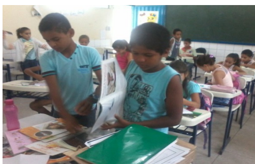
Fig.8. Motivation and engagement in learning