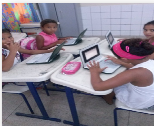
Fig.7. Partnership and co-authoring: motivation in learning