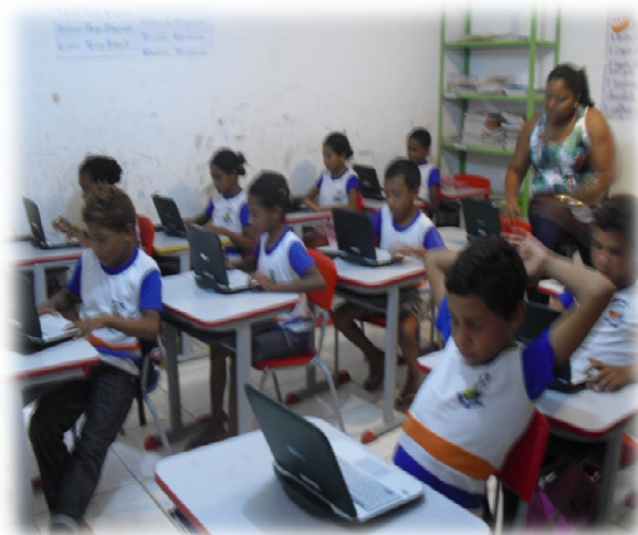
Figure 5. Classroom: debugging and systematization of new knowledge

Figura 5. Sala de aula: depuração e sistematização dos novos saberes