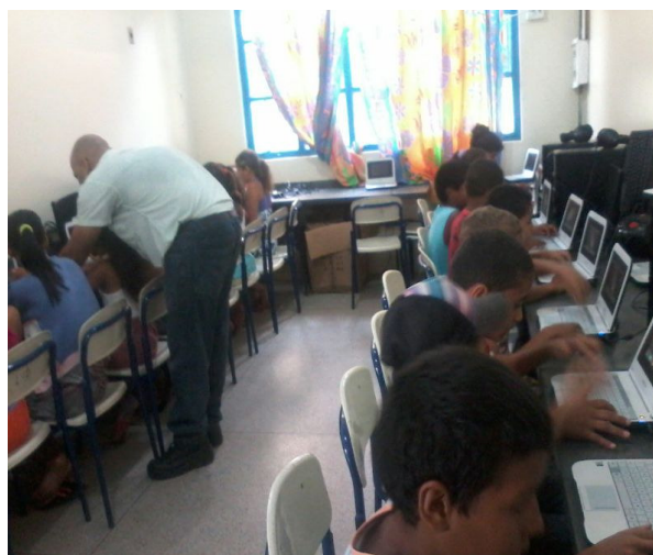
Fig. 6. Construction of comic books with the theme Navigate is needed, but safely!