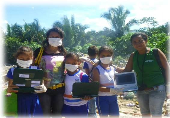
Figure 3. Environmental study-visit to the garbage dump of San Miguel (TO): partnership and active participation in the investigation of the topic to be unveiled active participation in the theme of the research to be