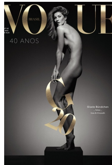
Figura 3: A modelo Gisele Bündchen na capa da revista Vogue Brasil, maio/2015

Se à primeira vista as duas revistas parecem assumir perspectivas editoriais divergentes, um olhar mais atento permite identificar, nas duas publicações, uma repetição de assuntos que reforçam os padrões normativos estéticos e de comportamentos femininos. Ao lado de editoriais que remetem a um rompimento com esses padrões, como “Love-se: em um mundo cada vez mais plural, aceitar-se é o novo preto” (p. 184), “Bonito é ser diferente: dê as boas-vindas a toda forma de beleza” (p. 188) e “Garota Rebelde: Rebel Wilson une diversão e empoderamento feminino” (p. 194); Elle também reproduziu conteúdos muito semelhantes à sua concorrente e ao que usualmente é pauta em suas edições: “Atualize seu look : turbine o closet de inverno” (p. 304), “Modos de usar: sexy sem ser perigete? Sim, é possível” (p. 312), “Elas: o fotógrafo Bob Wolfenson fala sobre a magia das supermodels” (p. 238).