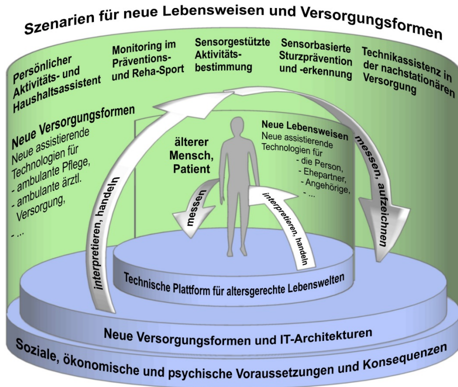
Abbildung 1: Der GAL-Doppelkreislauf: Der ältere Mensch im Fokus neuer technischer Assistenzsysteme (hier „neuer assistierender Technologien“).

Quelle: GAL (2014): 9; Haux u. a. (2014). Die oben aufgeführten Themen stellen die in GAL untersuchten Anwendungsszenarien dar.