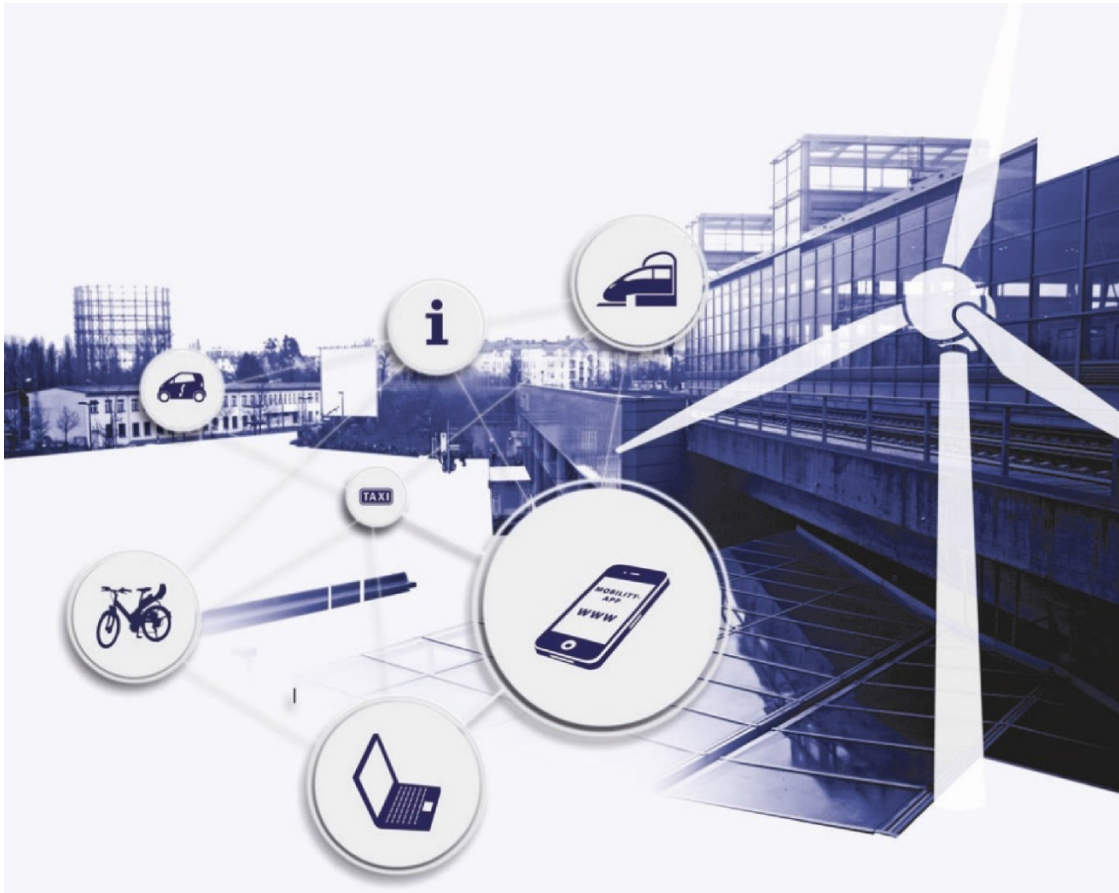
Abb. 2: Die Mobilität der Zukunft – Vernetzung von Mobilität, Energie und Informations- und Kommunikationstechnologien (2)