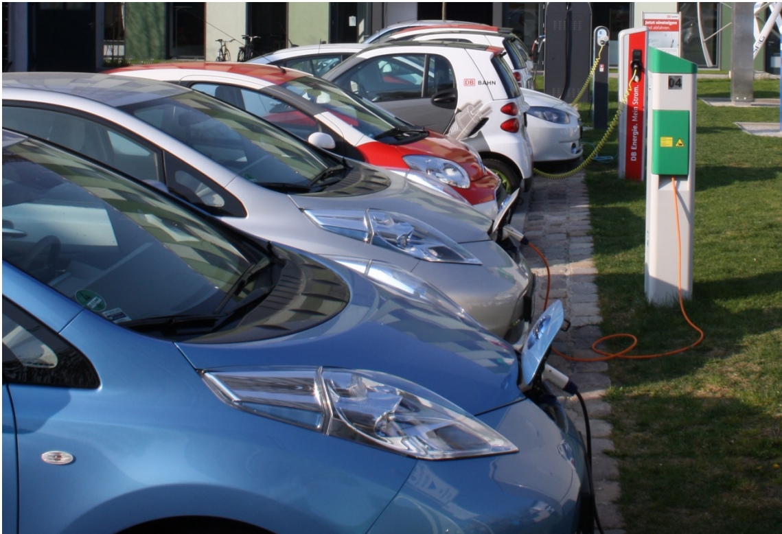
Abb. 2: Senkung des Verbrauchs fossiler Kraftstoffe durch den Einsatz alternativer Antriebstechnologien