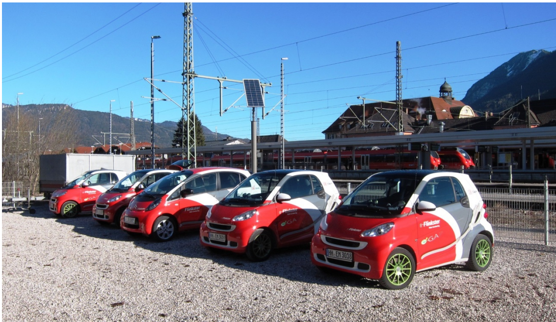
Abb. 3: Elektrisches Carsharing in Garmisch-Partenkirchen

Tabelle 5 gibt einen Überblick über abgeschlossene bzw. noch andauernde Forschungsvorhaben. Umgesetzt werden die Aktivitäten im Wesentlichen in Modellregionen und Leuchtturmprojekten, die sich in unterschiedlichen Strukturräumen befinden (städtische und ländliche Regionen). So wird beispielsweise in der Modellregion Bad Neustadt an der Saale unter anderem die technisch-industriell geprägte Wirtschaftsstruktur in Kombination mit der Elektromobilität untersucht. In der Modellregion Garmisch-Partenkirchen geht es schwerpunktmäßig um die Entwicklung der Elektromobilität im Hinblick auf ein nachhaltiges Mobilitätsverhalten für Besucher und Touristen (vgl. Abb. 3) (vgl. den Beitrag Ebert in diesem Band). In der Modellregion E-WALD im Bayerischen Wald soll gezeigt werden, dass Elektromobilität auch im ländlichen Raum und unter schwierigen natürlichen Rahmenbedingungen (unter anderem klimatisch und topografisch) realisierbar ist (vgl. den Beitrag Weber in diesem Band). 4