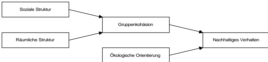
Abb. 1: Die Hypothesen des WohnNach-Projektes (nach Harloff et al., 1998, S. 51)

tiale ungenutzt lassen oder schlimmstenfalls sogar auf den Widerstand der Bewohner stoßen. Sind die sozialen Beziehungen der Bewohner hingegen bekannt, können sie für die geplanten Interventionen genutzt werden und damit deren Effektivität erhöhen.