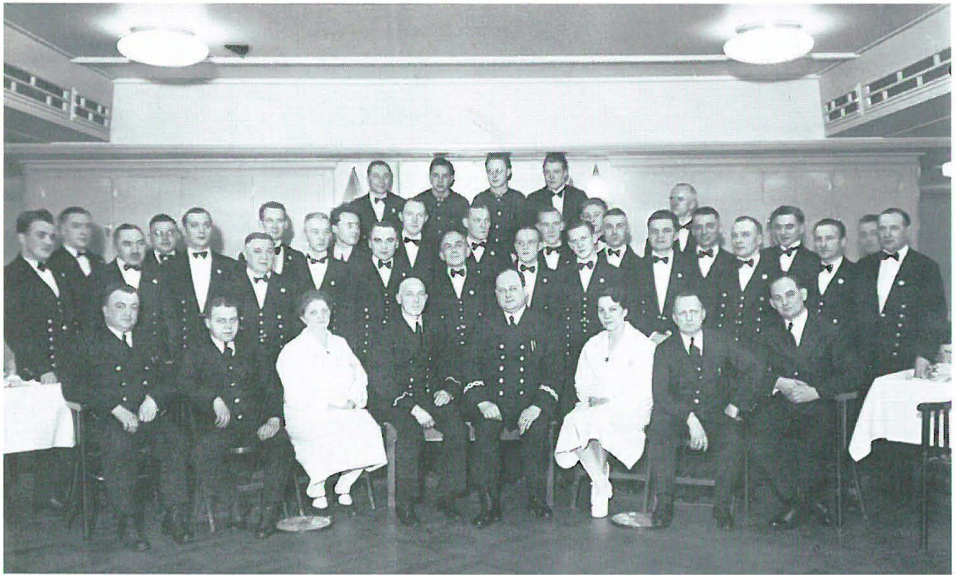
Gruppenbild der Bedienung für die Touristenklasse an Bord der EUROPA 1936, darunter zwei Frauen.

wollte, was für Fahnen gesetzt würden usw. – Na, die Journalisten werden ja mit die am meisten Enttäuschten sein, wieviele Seiten hätten sie füllen können! Wir werden dadurch eine Menge Passagiere aus Cherbourg verlieren, denn von dort sollten ja auch noch eine Menge Journalisten mitkommen und das Gefolge ... fasste ja auch eine Anzahl Leute. – Wenn wir einen witzigen Menschen hier hätten, dann könnte er eine schrecklich komische Geschichte schreiben. 22