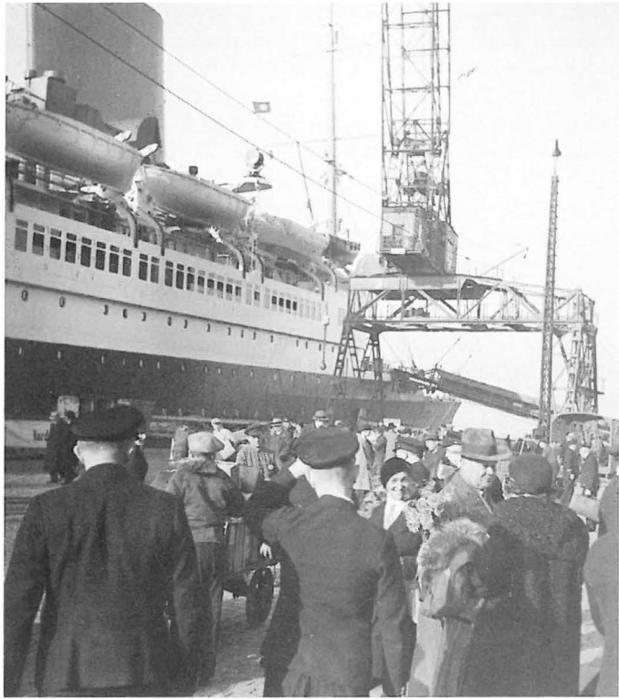
Schnelldampfer BREMEN an der Columbuskaje.