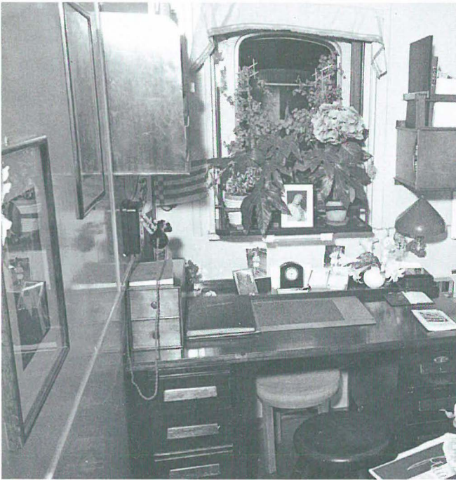
Tintoretta's Büro auf der BREMEN.

hier zitierten Beispiel – in Form von Erfolgsmeldungen. Vorher holte mich ein Funker, weil eine Dame oben sei und durchaus den Kapitän sprechen wollte und das ginge jetzt doch nicht (ich freue mich, dass sie jetzt scheinbar anfangen zu verstehen, dass sie dann in solchen Fällen zu mir kommen). Na, ich ging denn auch gleich hin, aber sie war in der Zeit schon wieder weggelaufen und sass mit einem – – – Pagen auf einem Deckstuhl und diktierte ihm einen Brief an den Kapitän. Zu mir sagte sie, sie müsse ihn sofort sprechen, denn sie würde schon seit Tagen als Spionin verfolgt, sie hätte deshalb schon ihre Passage von der BERENGARIA auf die BREMEN gewechselt, aber hier ginge es wieder los, na, kurz und gut, ich merkte gleich, dass bei der was nicht stimmte und holte unauffällig Dr. Fischer zu ihr, der nun jetzt noch mit ihr verhandelt, wahrscheinlich wird er sie ins Hospital nehmen müssen.