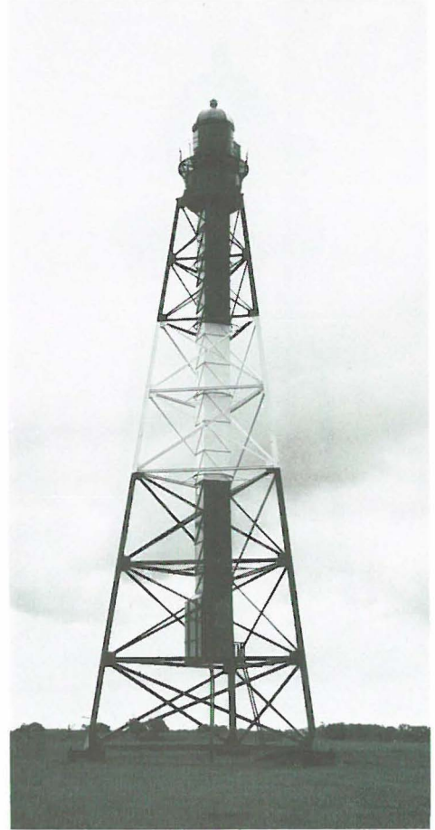
Links: Unterfeuer Großerpater; rechts: Oberfeuer Großerpater.