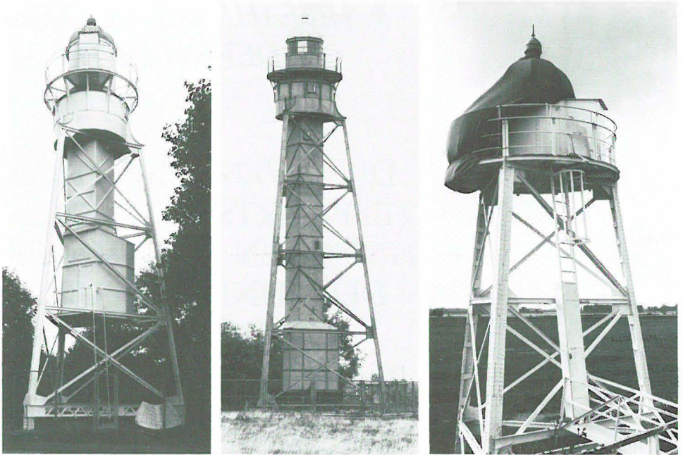
Links: Unterfeuer Großsiesel; Mitte: Altes Oberfeuer Sandstedt; rechts: Altes Unterfeuer Sandstedt vor dem Abbruch an seinem ursprünglichen Standort.

und deren Bemühungen um technische Denkmäler ergänzt, ohne zu Überschneidungen und Doppelarbeit zu führen.