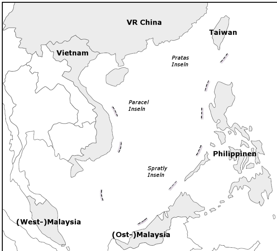
Grafik 3: Die von Taiwan kontrollierten Inseln