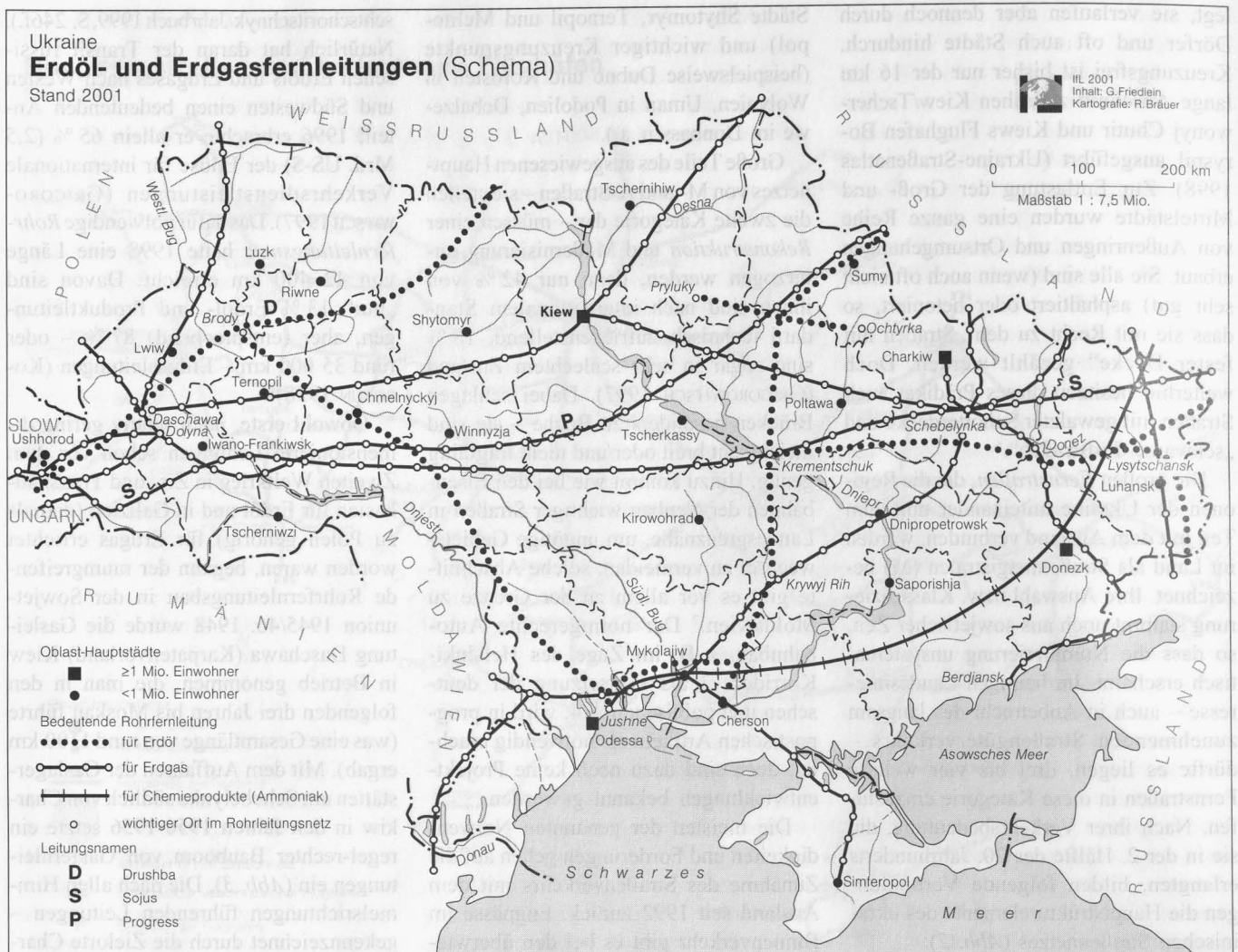
Abb. 3: Ukraine – Erdöl- und Erdgasfernleitungen (Schema)

Quellen: (Schulatlas) Heohrafijska Ukraïny (Geographie der Ukraine), Kiew 2000; KOROTUN 1998