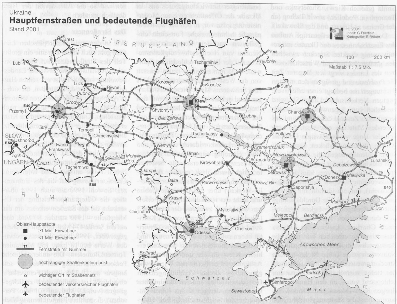
Abb. 2: Ukraine – Hauptfernstraßen und bedeutende Flughäfen