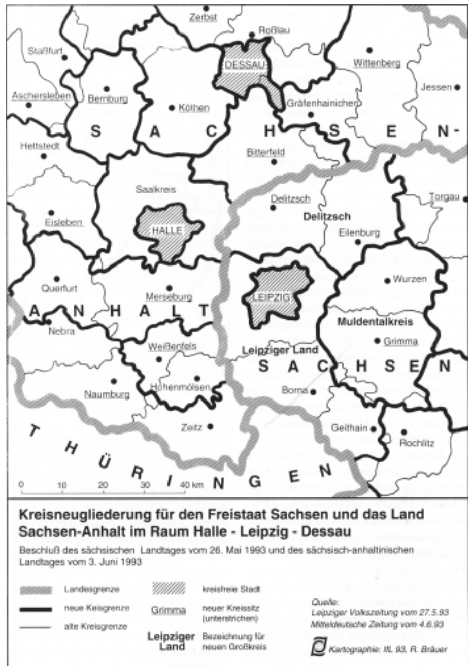
Abb. 3a: Kreisneugliederung im Raum Halle-Leipzig-Dessau

Die Gebietseinteilung beinhaltet ein starkes strukturelles Ungleichgewicht zwischen den dynamischen Gemeinden, die an Leipzig angrenzen und dem vom rückläufigen Braunkohlenbergbau und teilweise stark ländlich geprägten Raum im Süden. In Sachsen-Anhalt wurde der Saalkreis mit rund 60 000 Einwohnern beibehalten, der damit unter dem vorgeschriebenen Mindestsoll (80 000 EW) liegt 4 . Die Kreisreformmodelle der Länder Sachsen und Sachsen-Anhalt stellen für die jewei-