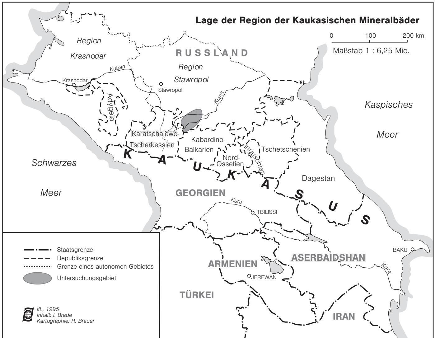
Abb. 1: Die Lage der Region der Kaukasischen Mineralbäder

Mineralwassern analoger Typen vorhanden.