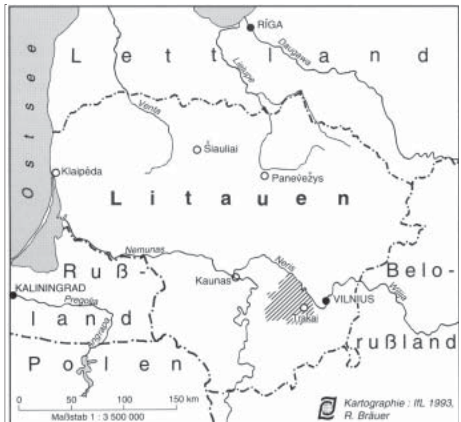
Abb. 3: Lage der Region Trakai in Litauen

Die Freigabe der Betriebsmittelpreise bei zunehmend eingeschränktem Angebot und die gleichzeitige Festlegung nicht