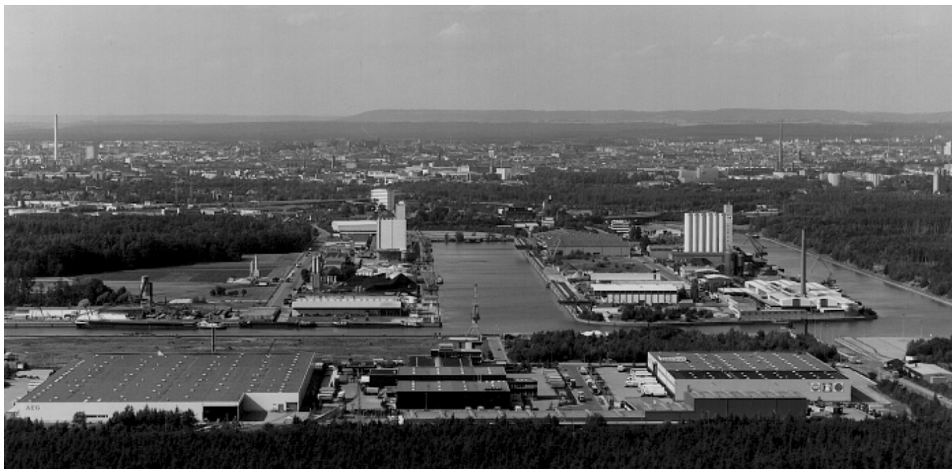
Abb. 5: Main-Donau-Kanal – Nürnberger Hafen