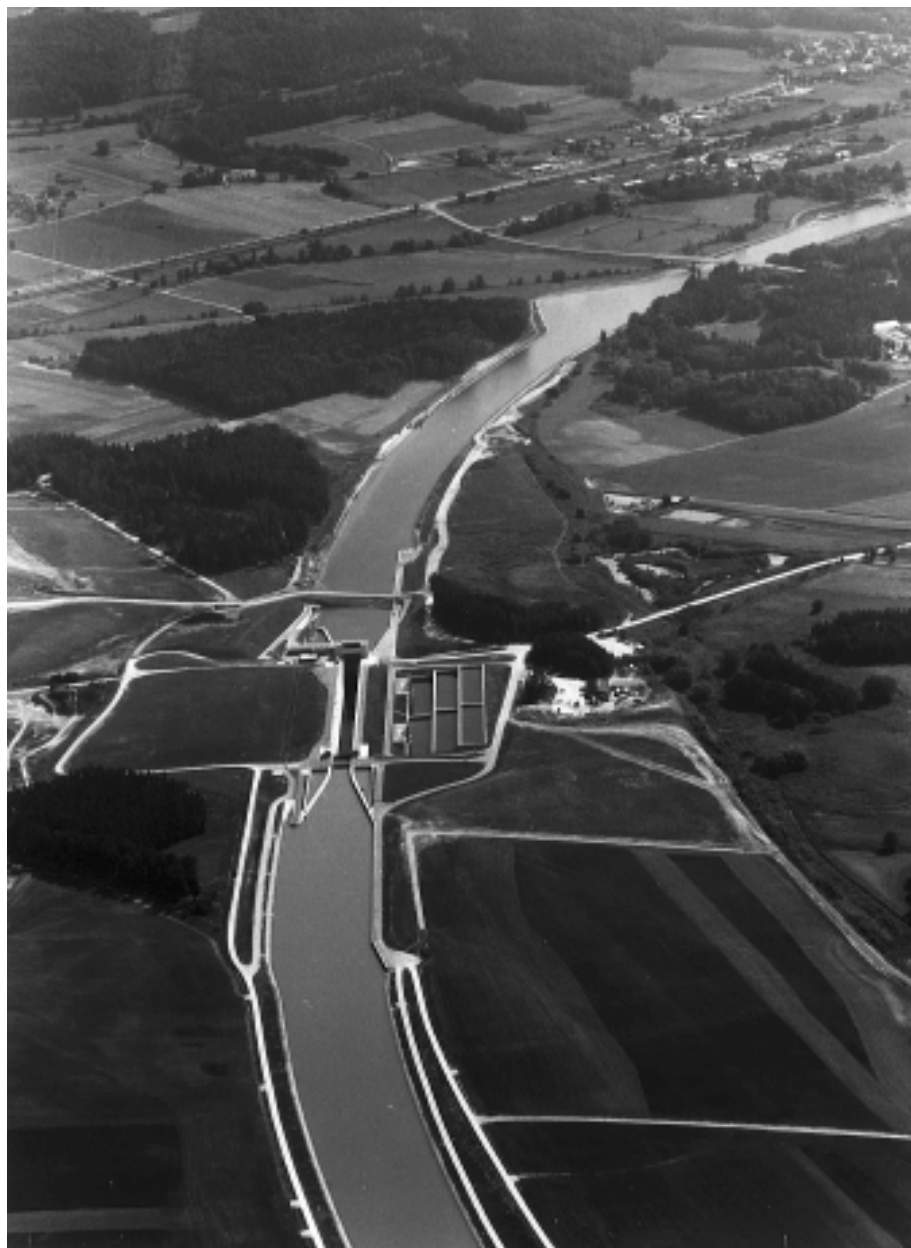
Abb. 4: Main-Donau-Kanal – Schleuse Bachhausen

Für den 171 km langen Kanal wurden insgesamt 16 Schleusen errichtet. Die Innenabmessungen aller 16 Schleusen betragen 12 m in der Breite und 190 m in der Länge, so daß beispielweise zwei Gütermotorschiffe von 90 m Länge und 1500 t Tragfähigkeit oder ein zweigliedriger Schubverband mit einer Länge von 185 m und einer Tragfähigkeit von 3300 t geschleust werden können. Um den Bedarf an Betriebswasser möglichst niedrig zu halten, wurden die Schleusen mit Aus-