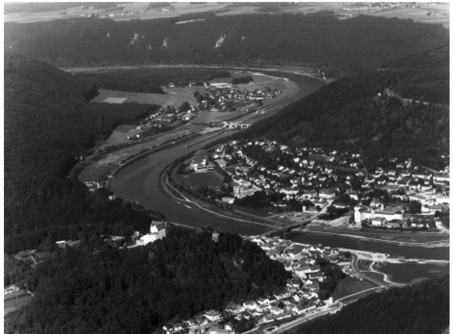
Abb. 1: Main-Donau-Kanal – Staustufe Riedenburg

glied zwischen den Stromsystemen von Rhein und Donau auf seinem Staatsgebiet beheimatet, sondern daß, bezogen auf die gesamte Streckenlänge der Rhein-Main-Donau-Schifffahrtsstraße territorial betrachtet, der größte Anteil der Wasserstraße innerhalb der bayerischen Grenzen liegt. Überboten wird dieser Wert nur vom rund 1000 Kilometer langen rumänischen Donauabschnitt, der aber im wesentlichen von seiner Funktion als Grenzfluß insbe-