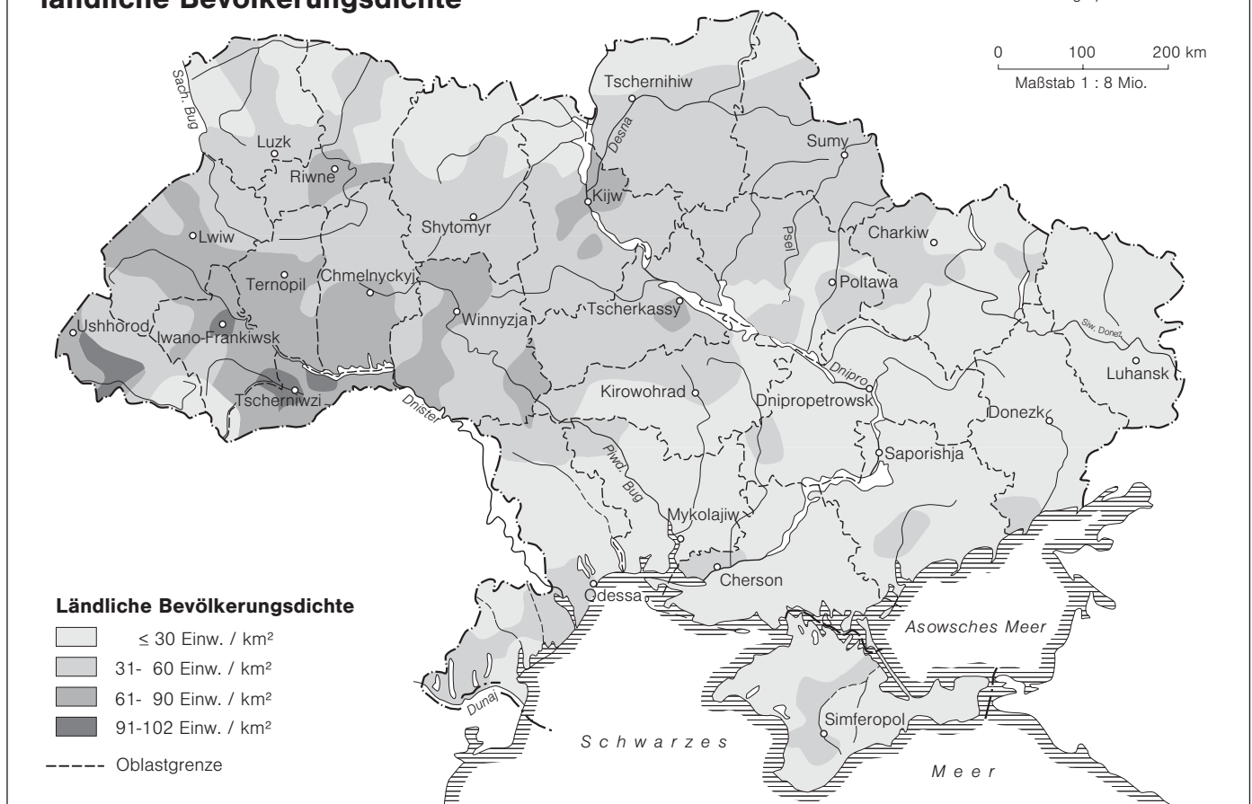
Abb. 2: Verwaltungsgliederung und ländliche Bevölkerungsdichte der Ukraine

IfL 1997 Inhalt: G. Friedlein Kartographie: R. Bräuer