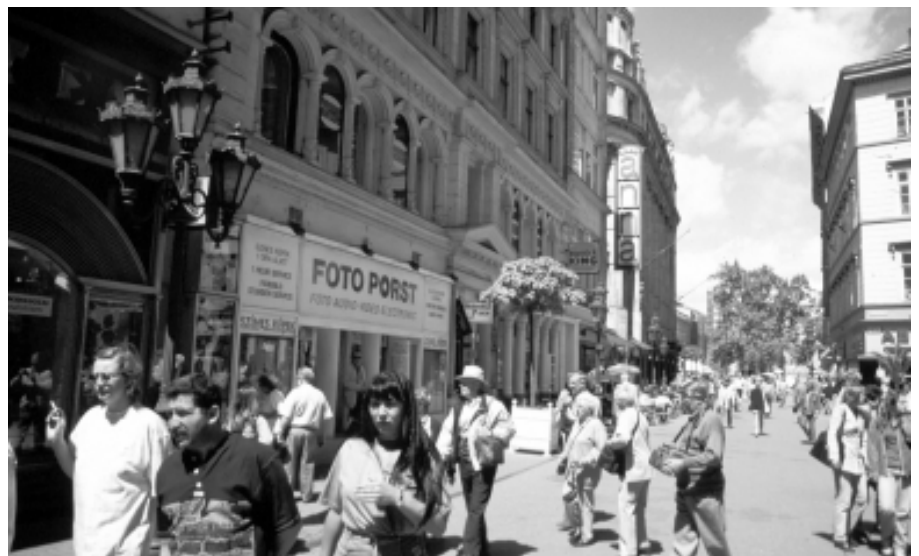
Foto 2: Die Váci utca in Budapest. Die Fußgängerzone ähnelt in ihrer Einzelhandelsstruktur schon deutlich einer (beliebigen) mitteleuropäischen Großstadt.