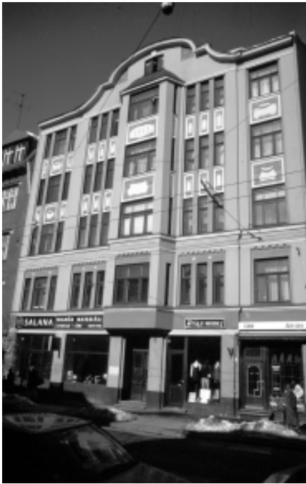
Foto 3: Ein Beispiel für ein restituiertes Wohn- und Geschäftshaus im Zentrum von Riga (Tērbatas iela). Mit der Rückgabe an den Alteigentümer hat ein vollständiger Wandel in der tertiären Nutzung des Erdgeschosses stattgefunden. Aufgrund der guten Mieteinnahmen war es bereits möglich, den Außenbereich des Gebäudes zu renovieren.