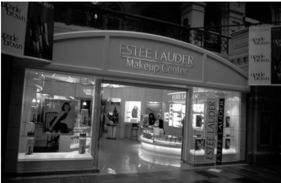
Foto 1: Eines von vielen exklusiven Geschäften im Moskauer Kaufhaus GUM. Die Konkurrenz der ausländischen Anbieter ist groß, die Nachfrage hält sich noch in bescheidenen Grenzen.