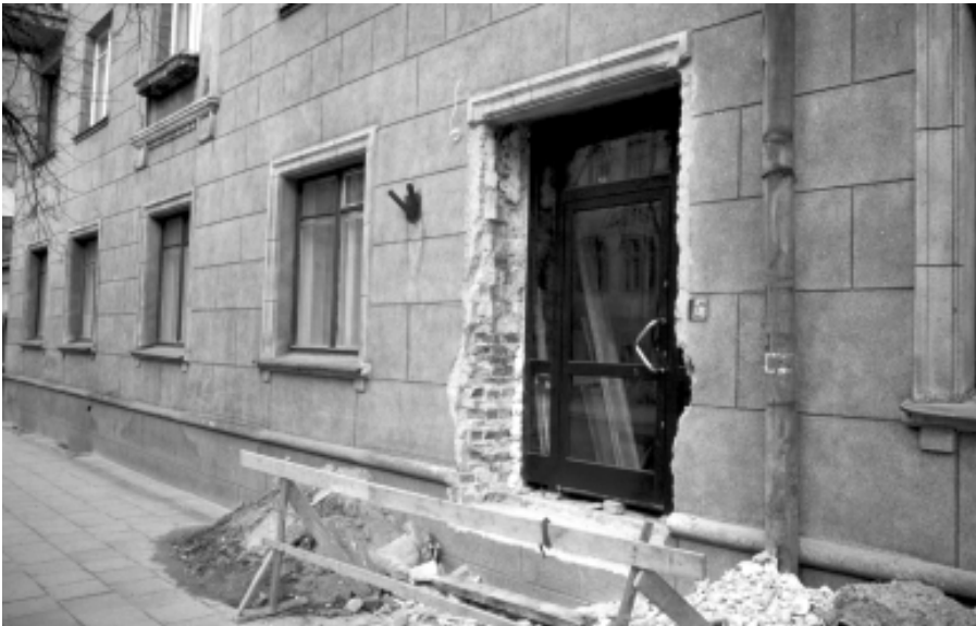
Foto 4: Die Umwidmung von Wohnraum im Erdgeschoß eines bislang reinen Wohnhauses in der Jasinskio gatve von Vilnius, einer wichtigen Verkehrsstraße im Innenstadtrand. Der Zugang zum neuen Geschäft (einer Modeboutique) wird mit Hilfe einer noch zu bauenden Außentreppe geschaffen.