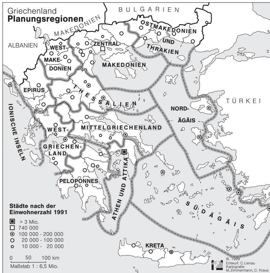
Abb. 1: Die griechischen Planungsregionen