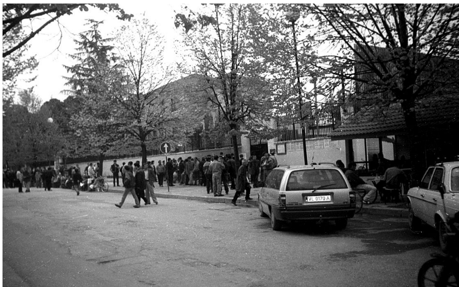
Foto 1: Italienische Botschaft in Tirana: Täglich versuchen viele Leute, ein Visum nach Italien zu bekommen.