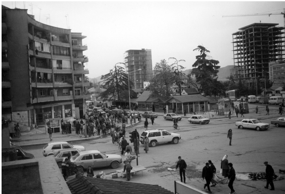
Foto 2: „Arbeitsmarkt“: Arbeitslose warten auf einen Arbeitgeber (vor allem aus dem Bausektor); Verkauf von Waren auf der Straße (informeller Sektor) in Tirana

Bei einer Analyse der regionalen Verteilung der Arbeitslosigkeit nach Bezirken und Regionen Albaniens (vgl. Abb. 2) kann v. a. die höhere Arbeitslosigkeit in Mittelalbanien als problematisch eingestuft werden. Es handelt sich, wie schon erwähnt wurde, um den bevölkerungsreichsten Teil des Landes mit massiver Zuwanderung. Besonders die Bezirke, in denen in der kommunistischen Zeit die wichtigsten Industrieorte des Landes lagen (wie Elbasani, Laçi, Kuçova) sind von der Arbeitslosigkeit mit Quoten von über 30 % besonders betroffen. Die Industrie ist heute stillgelegt; die meisten Arbeitskräfte sind arbeitslos. Ein Beispiel: Allein das Stahlwerk von Elbasan hat 12.000 Beschäftigte