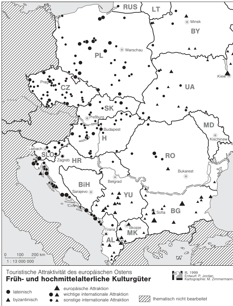
Abb. 2: Früh- und hochmittelalterliche Kulturgüter

diesen Reichen, auf heute ukrainischem Gebiet auch durch die Mongoleneinfälle zur Mitte des 13. Jahrhunderts, etliche dieser Kulturgüter verloren, doch blieben viele gut bewahrt, besonders im westlichen Bulgarien (Rila, Bačkovo), im westlichen Makedonien (Jovan Bigorski, Ohrid, Sveti Naum), im südlichen Serbien (Studonica, Sopoćani), im heutigen Kosovo (Gračаница/Gračanice, Peć/Pejë) und in Montenegro (Morača).