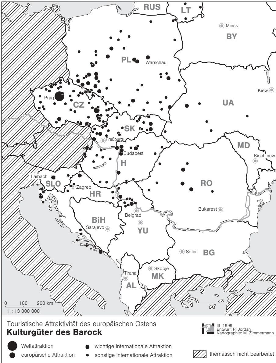
Abb. 4: Kulturgüter des Barock

denen es an innovativer künstlerischer Ausdruckskraft mangelte und die sich lediglich in einer Wiederholung älterer Stilrichtungen ergingen, hinterließen sie doch auch originelle Werke, besonders in Form des Jugendstils und der Ingenieurkunst (technische Bauwerke wie Brücken, Bahnhöfe, Ausstellungshallen etc.). Für den heutigen Tourismus kann dennoch auch das eklektizistische, historistische Schaffen dieser Epoche attraktiv sein, wie es sich v. a. in Verwaltungs-, Kultur- und Bildungsbauten (Opernhäuser und Theater, Schulen, Universitäten), Verkehrsbauten (Bahnhöfe, Stationen städtischer Verkehrsmittel, Brücken), Sozialbauten (Krankenanstalten) und Tourismusbauten (Hotels, Kurhäuser, Landvillen) sowie in Straßen- und Parkanlagen manifestierte. Selbst gründerzeitliche Wohnhausensembles wie großbürgerliche städtische Miethäuser