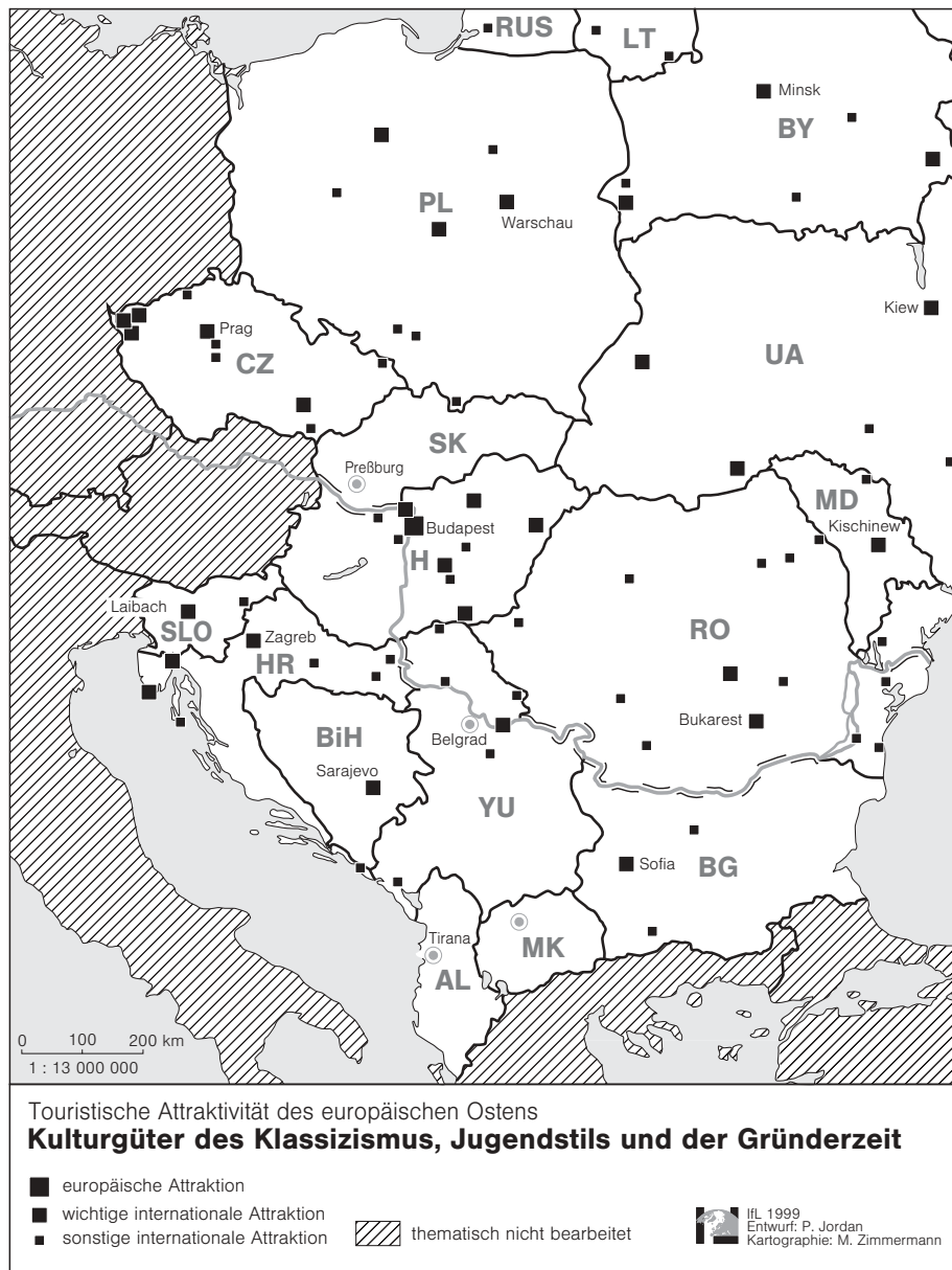
Abb. 5: Kulturgüter des Klassizismus, der Gründerzeit und des Jugendstils

Stadtkernen manchmal nicht viel mehr als den Straßengrundriß übernahm.