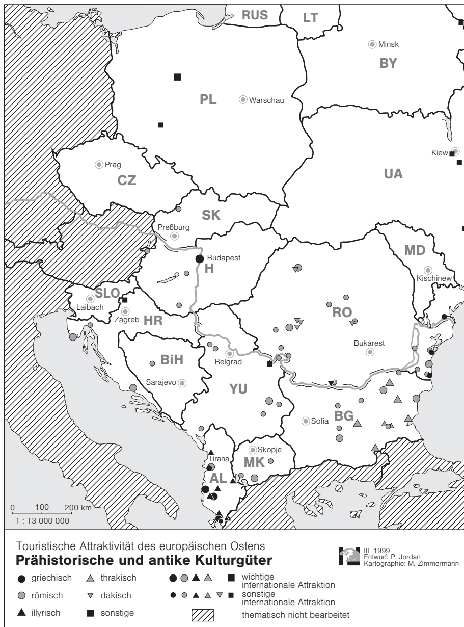
Abb. 1: Prähistorische und antike Kulturgüter

(Savaria), Budapest (Aquincum), Jajce, Bitola (Heraclea), am Eisernen Tor (Portile de Fier/Đerdap), in Niš, Plovdiv, Razgrad, an etlichen Orten Daziens wie Moigrad oder Sarmizegetusa – sind wichtige Baudenkmäler erhalten geblieben. Neben den vorrömischen, dakischen, werden sie in Rumänien als Zeugen lateinischer Tradition sehr hoch bewertet und mit Stolz präsentiert.