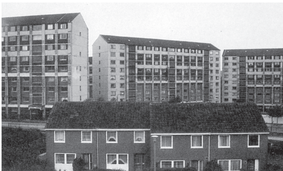
Foto 2: Niedriggeschossige Wohngebäude neben vielgeschossigen Wohnblocks in Wester Hailes/Edinburgh

Von britischen Autoren wurden interessante Studien, die die inneren Einflüsse der Siedlungen behandeln, veröffentlicht. In Bezug auf das Wohnumfeld kritisierte man vor allem die