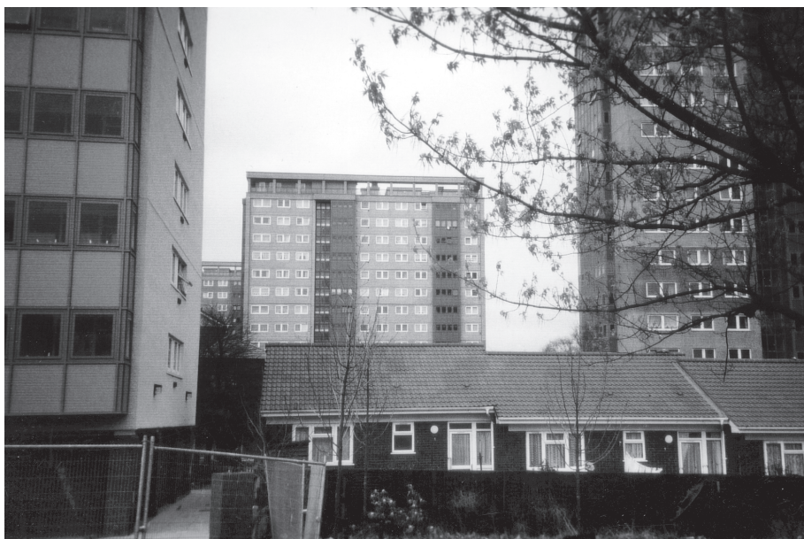
Foto 1: Niedriggeschossige Wohngebäude neben vielgeschossigen Wohnblocks in Newtown/Birmingham

Diese Studie unterscheidet zwischen inneren und äußeren Faktoren, wel-