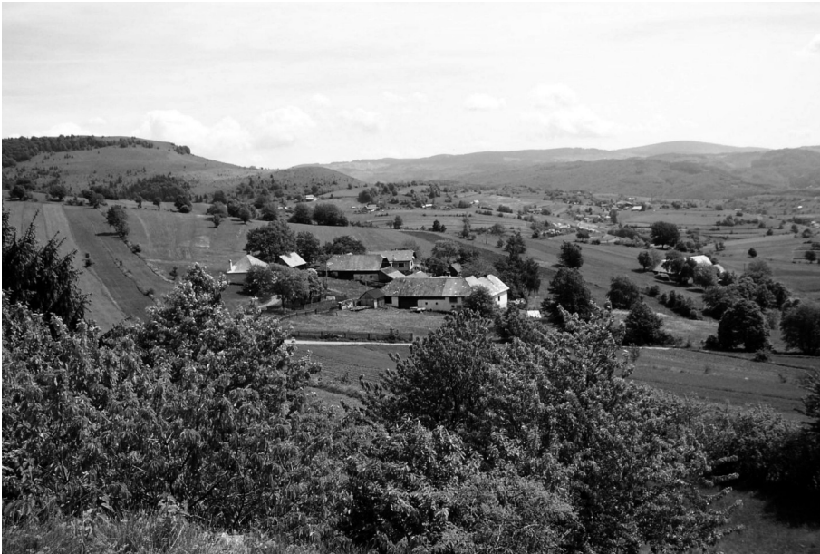
Foto 1: Die Streusiedlungsbewohner gehen sehr behutsam mit der Natur um. Das Ergebnis dieses Prozesses ist ein Nutzungsmosaik.