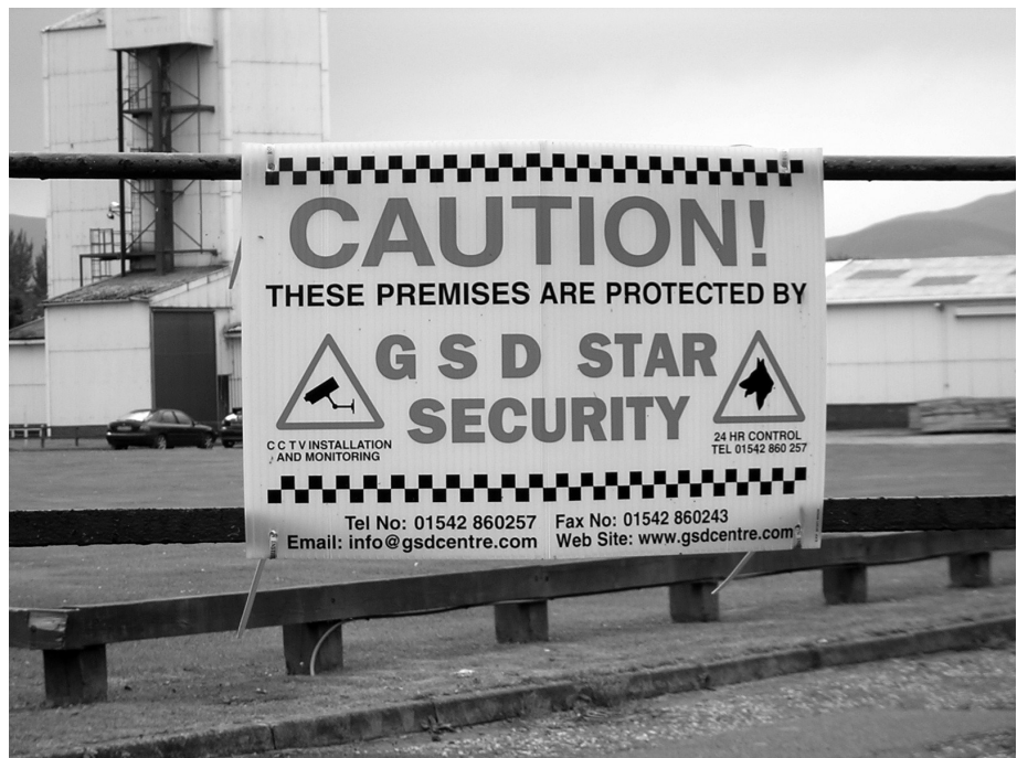
Foto 1: Strengste Sicherheitsvorkehrungen schützen die biotechnologische Forschung am Roslin Institut bei Edinburgh

Bereits der 1999 veröffentlichte Bericht des damaligen britischen Wirtschaftsministers Sainsbury untersuchte die bestehenden Biotechnologie-Cluster in Großbritannien und gab Empfehlungen für deren Weiterentwicklung (DTI 1999a). So nennt der Bericht zehn Hauptfaktoren, durch die die Entwicklung von Biotechnologie-Clustern gefördert werden kann. Dazu zählen eine starke Wissenschaftsbasis, eine ausgeprägte Unternehmenskultur, die Fähigkeit der Region, qualifiziertes Personal anzuwer-