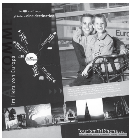
Abb. 4: Ankommen im Herzen von Europa

Nachdem 1991 die Freiburger Regio-Gesellschaft ein gemeinsames Pauschalangebot vorgeschlagen hatte („Drei Länder in drei Tagen“), das aber in der Schweiz und im Elsass kein Echo fand, bemühen sich die vier Städte Colmar, Basel, Mülhausen und Freiburg seit Anfang der 1990er Jahre zusammen mit dem EuroAirport um grenzüberschreitende Tourismusprojekte und gemeinsames Marketing. Unter dem Motto „3 Länder – 4 Städte – 2 Sprachen – 1 Flughafen“ entwickelten die Kooperationspartner ein gemeinsames Werbe- und Marketingkonzept; eine zweisprachige Image-Broschüre und ein mehrseitiger Faltprospekt sowie die Beschickung