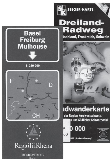
Abb. 6: Karten des trinationalen Oberrhein-gebietes

Der wachsenden Verflechtung und Nachfrage beginnt auch die Tourismuswirtschaft Rechnung zu tragen. Das lange währende Kirchturmdenken ist nunmehr der Einsicht gewichen, dass die Landschaft am Oberrhein mehr bedeuten kann als die Summe der Teilgebiete. Beim 1. Trinationalen Tourismustag am 22.03.05 fasste Landrat J. Glaeser die Chancen der Komplementarität mit folgender Empfehlung zusammen: „Nur wenn wir auch für die Highlights der anderen Nachbarn werben, lässt sich der eigene touristische Erfolg verbessern.“ Dies gilt zwar besonders im Hinblick auf die Induzierung des sekundären Ausflugsverkehrs, fördert aber auch die nachbarschaftlichen Freizeitbeziehungen über den Rhein.