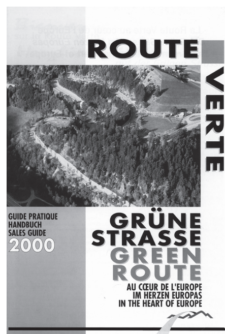
Abb. 3: Route Verte

Obwohl sich bereits 1960 je 5 lothringische, elsässische und badische Gemeinden zur einheitlich ausgeschilderten touristischen Route verte/Grünen Straße zusammenschlossen (vgl. Abb. 3), bestand bis in die jüngste Zeit kaum eine grenzüberschreitende Kooperation der