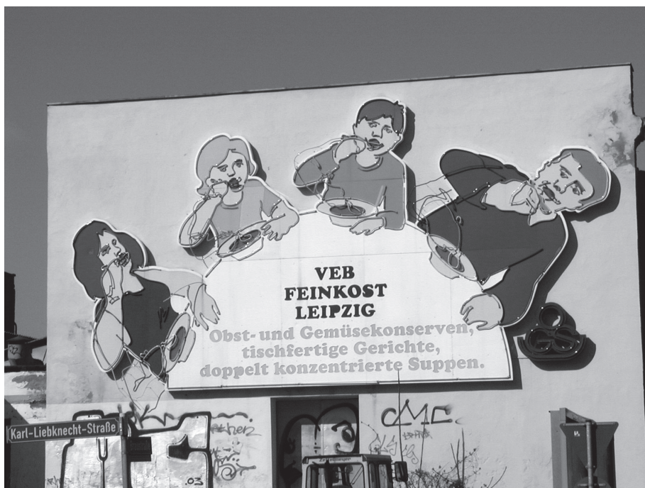
Foto 2: Die „Löffelfamilie“ auf dem ehemaligen „Feinkostgelände“ – ein Symbol für „buntes Szeneleben“ in der Südvorstadt?

Das Gebiet Neustädter Markt/Volkmarisdorf im Osten Leipzigs ist ein Quartier, das im Zuge der Industrialisierung schnell und in einfacher Bauweise für die zuziehende Arbeiterschaft angelegt wurde (Foto 3). Bereits Anfang der 1990er Jahre war es durch höhere Leerstände