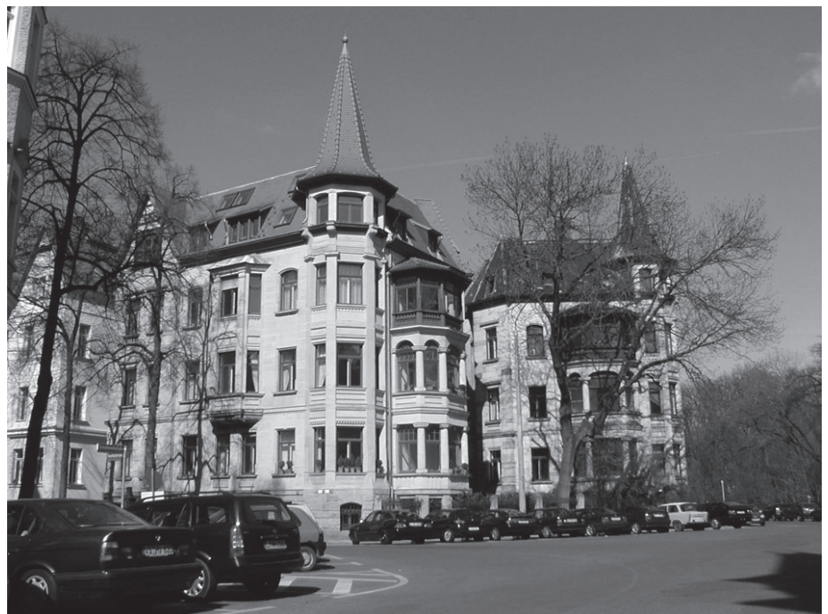
Foto 1: Repräsentative Wohnbebauung im Waldstraßengebiet – Symbol für Wohlstand und Bürgerlichkeit Foto: A. Hill 2004

Die innere Südvorstadt ist der Stadtteil Leipzigs, der von innerstädtischen Wanderungen in den letzten Jahren mit am stärksten profitiert hat (WIEST 2004, S. 264). Hinsichtlich seiner baulichen Strukturen ist das Gebiet sowohl durch äußerst repräsentative Gebäude als auch durch klassische Blockrandbebauung charakterisiert. Von Bedeutung sind die Nähe zu Hochschuleinrichtungen sowie zur städtischen Grünachse und die Tat-