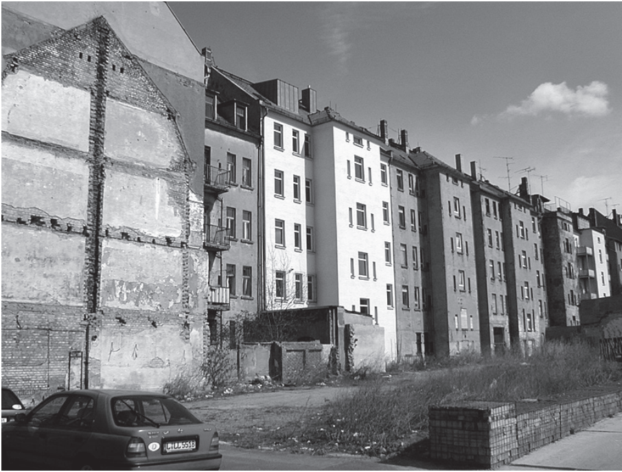
Foto 3: Leerstand und städtebauliche Probleme – das Image des Neustädter Marktes

gekennzeichnet als der gesamtstädtische Durchschnitt. Seit 1999 ist es Teil des Programmgebietes „Soziale Stadt“ und damit von administrativer Seite als Gebiet mit besonderen Entwicklungsproblemen definiert. Durch eine relativ starke überregionale Zuwanderung ist unter anderem der Anteil der Migranten aus dem Ausland im Vergleich zur Gesamtstadt deutlich erhöht (vgl. WIEST u. HILL 2004, S. 369). Von den Leipzigern werden in diesem Stadt- raum tendenziell Abwertungsprozesse vermutet (Karte 1). Im Rahmen der Tiefeninterviews wurde zwar häufig in Frage gestellt, dass es sich hier um ein soziales Problemgebiet handelt, gleichzeitig wurde die Wohnadresse mit fehlendem gesellschaftlichen Einfluss oder kulturellen Kompetenzen gleichgesetzt. Wie die folgenden Randbemerkungen verdeutlichen, enthielten die in der Regel sehr differenzierten Aussagen der Gesprächspartner implizit Bezüge auf Zusammenhänge zwischen Wohnort und sozialer Position, die auf gesellschaftlich geteilte Sinnstrukturen über städtische Teilräume verweisen: „die Leute die hier wohnen, die haben keine Macht und keinen großen Einfluss ...“ (wiss. Angestellter, 40 Jahre, mit Familie). „... oder Kultureinrichtungen, die ja hier in dem Stadtteil auch nicht so viele Leute nutzen würden, also jetzt zumindest Oper oder Theater. Das ist ja jetzt eher nicht vorstellbar“ (Student, 26 Jahre). Latent wurden in allen Gesprächen Aspekte sozialer Benachteiligung oder Marginalität über die Themenfelder Drogen-