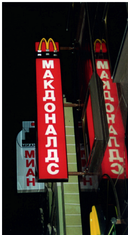
Abb. 1: McDonald's in Moskau

Dieses – auch aus der Innenperspektive – wesentliche Ereignis wurde in einen Zusammenhang mit der Verwestlichung des Konsums und der Kultur gebracht und mit einer spezifischen Kritik an den fremden bzw. „unrussischen“ Einflüssen auf die eigene Kultur versehen. Eine solche Kritik an der Globalisierung, Amerikanisierung bzw. Verwestlichung des Konsums und damit der Kultur ist ein inhärenter Bestandteil dieser Prozesse. Verschiedene empirische Studien zu Europa und Asien zeigen, dass das Aufkommen von Marken wie Coca-Cola und McDonald's oftmals Kritik gegen fremde westliche bzw. amerikanische Einflüsse hervorrief (BAK 1997; MORSE