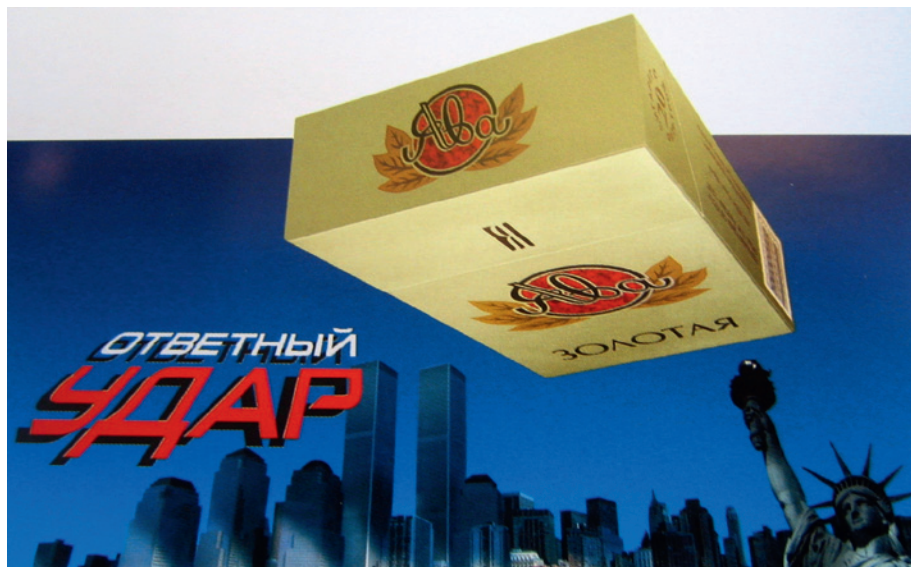
Abb. 3: „Gegenschlag“

Dass Globalisierung mit einer Aufwertung des Lokalen einhergeht und dass das Lokale gleichsam ein Aspekt des Globalen ist, wird mit dem Konzept der Glokalisierung betont. Kulturelle Globalisierung besteht so gleichzeitig aus homogenisierenden und heterogenisierenden Effekten (ROBERTSON 1995). Im Russland entstanden nach dem Übergang zum Markt verschiedenste Konsumangebote, die eine solche Gleichzeitigkeit globaler und lokaler Einflüsse widerspiegeln. Die Firma Mars entwickelte für den russischen Markt eine Version des Schokoladenriegels Twix mit dunkler Schokolade („Černyj-černyj Twix“), da die Nachfrage nach Bitterschokolade hier überdurchschnittlich hoch war. McDonald's ersetzte im Verlauf der 1990er Jahre in seinem Emblem die lateinischen Buchstaben durch kyrillische. Außerdem stellte das Marketing die Produkte dieses Restaurants am Ende der 1990er Jahre als einen Teil des lokalen Konsumangebots dar, was die Verbraucher so auch wahrnahmen (CALDWELL 2004). In diesen Beispielen wird die Gleichzeitigkeit globaler und lokaler Einflüsse auf die kulturelle Praxis in Form einer synchronen Nutzung beider Elemente für die Produktvermarktung evident.