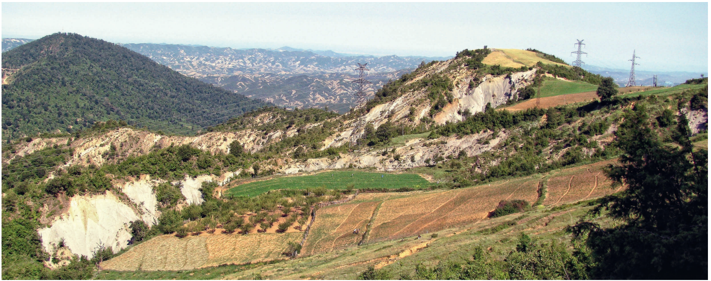
Foto: Degradierte Hügellandschaft in Mittelalbanien im Bezirk Elbasan

Relief, sondern eher an der kleinteiligen Betriebsstruktur. Vor allem in den Peripherien im Nordosten Albaniens ist die Landbevölkerung arm und die Infrastruktur schwach entwickelt (INSTITUTE OF STATISTICS 2008). In den Bezirken Kukës und Dibër sind die Betriebe besonders klein – es sind in Kukës 0,54 ha bei einer Feldgröße von 0,17 ha und in Dibër 0,5 ha und eine Feldgröße von 0,15 ha. (WELTBANK 2007, S. 6). Daraus ist der in Abbildung 1 dargestellte geringe Mechanisierungsgrad der Betriebe leicht zu verstehen.