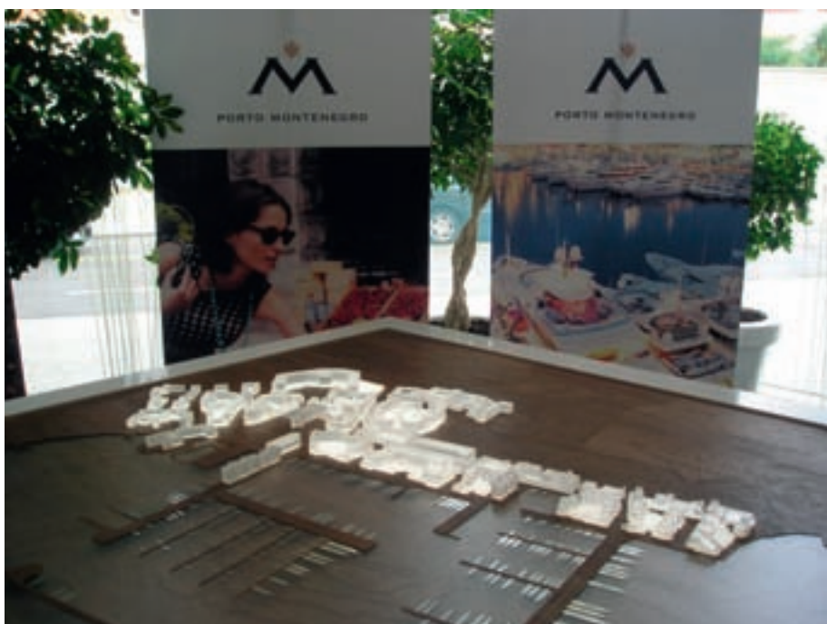
Foto 3: „Porto Montenegro“ – die luxuriöse Marina auf einer militärischen Konversionsfläche bei Tivat wird in einem 5-Sterne-Hotel beworben.

Liegeplätze fertig gestellt. Die Konversionsfläche verfügt über eine ausgesprochen vorteilhafte Lage innerhalb der Bucht von Kotor und ist sowohl vom internationalen Flughafen in Tivat als auch von den touristischen Attraktionen der Bucht nur wenige Kilometer entfernt. Neben den ganzjährigen Liegeplätzen werden dazugehörige Wohnresidenzen in unterschiedlichen Größenordnungen und Preisstufen zum Erwerb angeboten (Foto 3). Ein weiterer Ausbau der Anlage ist geplant, es ist die Rede von bis zu insgesamt 650 Liegeplätzen (UTTICH 2009).