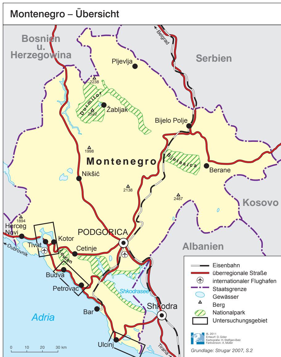
Abb. 1: Lage der Untersuchungsgebiete in Montenegro

auf den Routen internationaler Kreuzfahrtschiffe und ist Ziel eines Kulturtourismus im Hochpreissegment. Zwar verfügt auch Budva über einen Altstadtbereich, der dem Erscheinungsbild und genetischen Typus nach in einer Reihe mit Kotor oder dem deutlich bekannteren kroatischen Dubrovnik gesehen werden kann; mit gutem Grund wurde das Zentrum Budvas nach der Zerstörung durch das Erdbeben 1979 originalgetreu wieder aufgebaut. Hauptmotiv des Fremdenverkehrs ist hier allerdings ein saisonal eng begrenzter sommerlicher Badetourismus mit Gästen unterschiedlichster Provenienz und sehr heterogenen Sozialgefüges. Ähnliches gilt für Ulcinj im Süden Montenegros, wo eine albanischsprachige Bevölkerung die Mehrheit stellt (BOTTLIK 2008, S. 57). Dort prägt sommerlicher Massentourismus von Urlaubern aus dem nahen Albanien und Kosovo den engen Altstadtbereich.