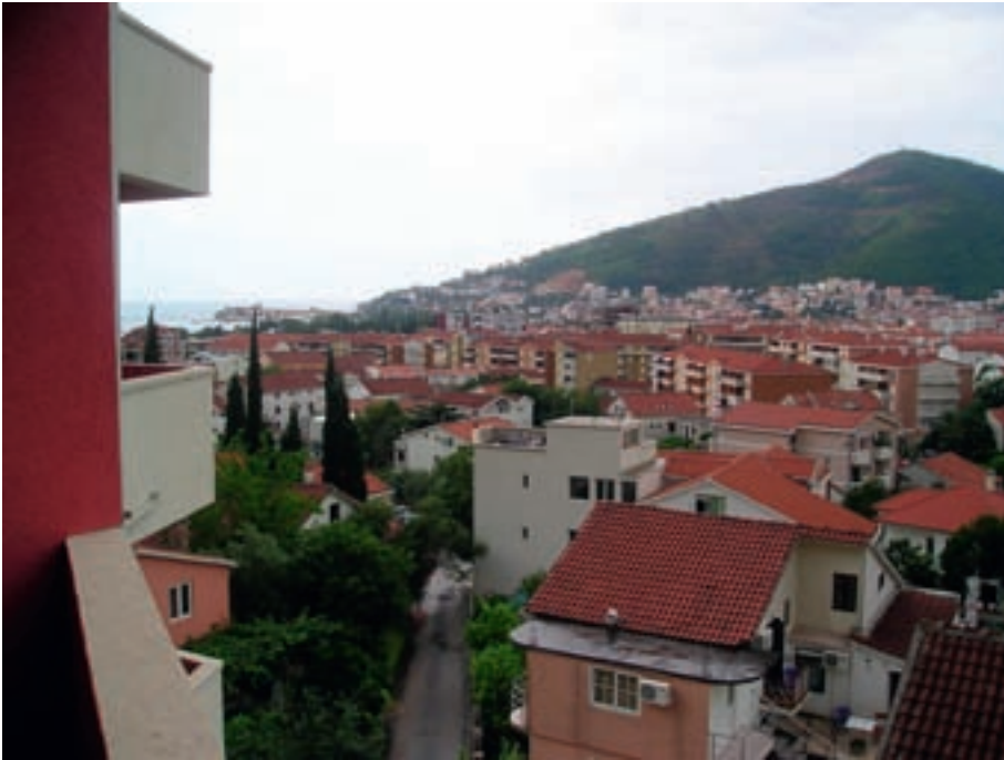
Foto 5: Die teilweise informelle Bebauung mit Appartementshäusern hat in Budva längst die Hanglagen erreicht; ein Ende des Baubooms ist nicht abzusehen. Foto: D. GÖLER, Juni 2009

Altstadtbereich selbst – nicht verhindert werden. Insofern skizzieren Mitarbeiter aus dem Planungsreferat als derzeitige Hauptaufgaben v.a. das Verhindern neuer informeller Siedlungen, welche dem derzeit erstellten neuen Urbanistikplan zuwiderlaufen würden, sowie die nachträgliche Legalisierung des älteren illegalen Gebäudebestandes.