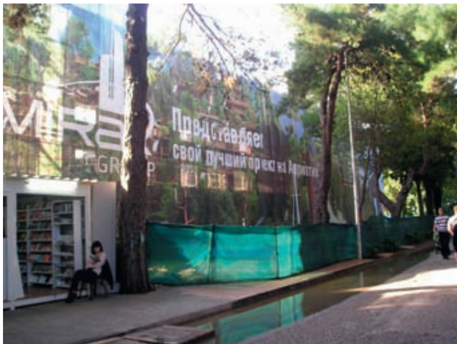
Foto 4: Russischer Reklametext an einer Baustelle in Budva: „Die Mirax Group stellt ihr bestes Projekt an der Adria vor“. Es handelt sich um die Überbauung der Halbinsel Zavala mit Appartements der Premium-Klasse, angeblich ein 200 Mio.-Euro-Investment.