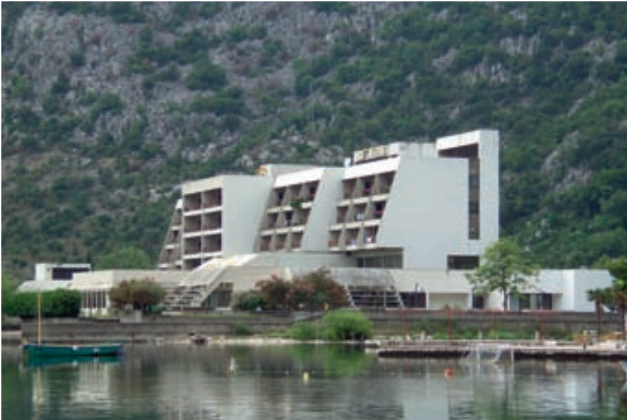
Foto 1: Hotelanlage aus jugoslawischer Zeit in Risan (Bucht von Kotor)

wirkt das sozialistische Aufbaukonzept nach, und zwar in positiver wie negativer Hinsicht. Hervorzuheben wäre insbesondere die infrastrukturelle Anbindung mit der im jugoslawischen Süden erst um 1973 erfolgten Fertigstellung der Adriamagistrale [Jadranska magistrala], jener Straßenverbindung also, welche die Erreichbarkeit der Orte entlang der östlichen Adriaküste vom kleinen Küstenanteil Sloweniens (fast) bis zur albanischen Grenze garantiert und deshalb bis heute von kaum zu überschätzender Bedeutung für Montenegro ist.