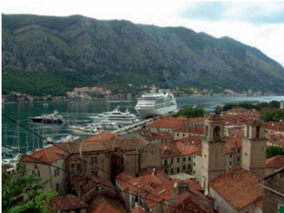
Foto 2: Kreuzfahrtschiffe können in Kotor vis-a-vis der Altstadt anlegen. Foto: H. LEHMEIER, Juni 2009

Weiterhin findet sich eine Reihe von Hotels aus dem ebenfalls international orientierten Vier-Sterne-Segment an der montenegrinischen Küste. So verfügt die historische Altstadt von Kotor über zwei Hotels dieser Kategorie; sie erhielten ihr heutiges Erscheinungsbild durch umfangreiche bauliche Um- und Neuge-