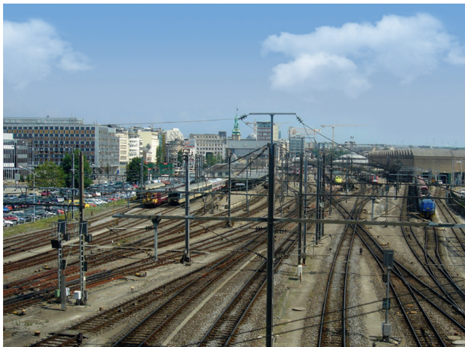
Abb. 2: Ankunftsort für viele Einpendler: Blick zum Bahnhof Luxemburg

Bedeutung, ebenso in Rheinland-Pfalz und in Wallonien, wo sich aufgrund steigender Miet- und Lebenshaltungskosten immer mehr Luxemburger ansiedeln und weiterhin im Großherzogtum beschäftigt bleiben. Festzuhalten ist, dass die Mehrzahl der Grenzgänger in Luxemburg arbeitet, gefolgt von Wallonien und dem Saarland. Demgegenüber stellt allein Lothringen weit über die Hälfte der auspendelnden grenzüberschreitenden Arbeitnehmer in der Großregion SaarLorLux, gefolgt von Wallonien (26 %) und Rheinland-Pfalz (13 %).