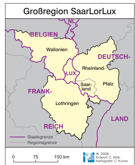
Abb. 1: Karte der Großregion SaarLorLux

Mit einer Gesamtfläche von 65.400 km 2 und etwa so vielen Einwohnern wie im Großraum Paris (ca. 11,3 Mio.) umfasst die Großregion SaarLorLux 1,6 % des Gebietes der 25 EU-Staaten und stellt europaweit rund 2,5 % der Bevölkerung (IBA 2007a, S. 14). Diese Kennziffern stehen für den politischen Kooperationsraum „Saarland – Lothringen – Luxemburg – Rheinland-Pfalz – Wallonien“, der sich über Teilgebiete der Nationalstaaten Deutschland, Frankreich, Lu-