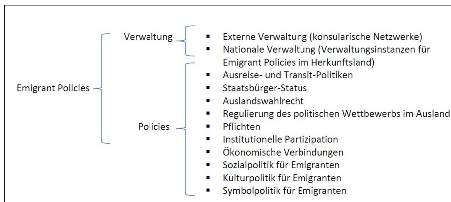
Abb. 1 Die zehn Dimensionen der „Emigrant Policies“

Die bisherige Forschung hat „Emigrant Policies“ in einzelnen Länderfallstudien oder entlang eines engen Ausschnitts politischer oder ökonomischer Dimensionen untersucht (Calderón 2004; Lafleur 2012; Escobar 2007, 2015). Die Arbeit von Margheritis (2016) umfasst mehrere Dimensionen, jedoch nur für wenige Länder. Bislang hat jedoch keine Studie die volle Breite der „Emigrant Policies“ für die ganze Region erfasst und vergleichend untersucht. Das diesem GIGA Focus zugrunde liegende Forschungsprojekt beschreitet hier Neuland. Es umfasst 22 Staaten der Region und hat für diese Daten erhoben, die ein sehr viel breiteres Raster von auf Emigranten gerichteten Politiken umfassen, als dies üblicherweise geschieht. Abbildung 1 zeigt diese vielfältigen Dimensionen. Neben der administrativen Dimension, die für die Umsetzung von „Emigrant Policies“ große Bedeutung hat, unterscheidet sie zehn Policy-Felder, in denen die Staaten auf ihre emigrierten Bürger gerichtete Politiken entfalten.