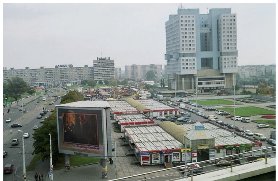
Foto 1: Das „Dom Sowetov“ im Jahr 2008 – im Vordergrund der Platz, an dem sich das Schloss befand

Die Wirtschaft der Stadt war in der Sowjetzeit stark durch Schiffsbau, Fischerei und Rüstungsindustrie geprägt. Ein Großteil der Bevölkerung wurde vom Militär beschäftigt. Die Industrie