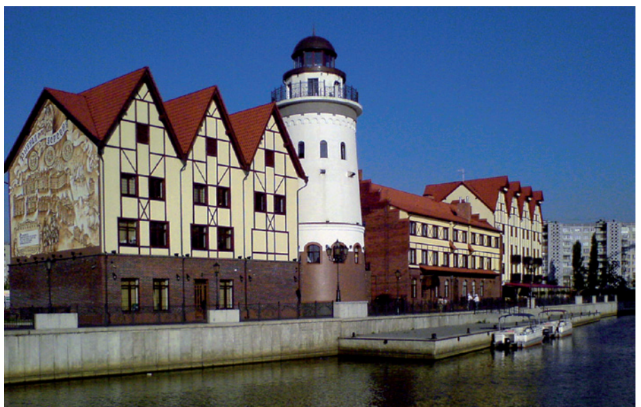
Foto 5: Historischer Bezug und wirtschaftliche Interessen – das Projekt „Fischdorf“ am Pregelufer

Der Platz verbindet somit ein wichtiges integratives Element der Sowjetzeit,