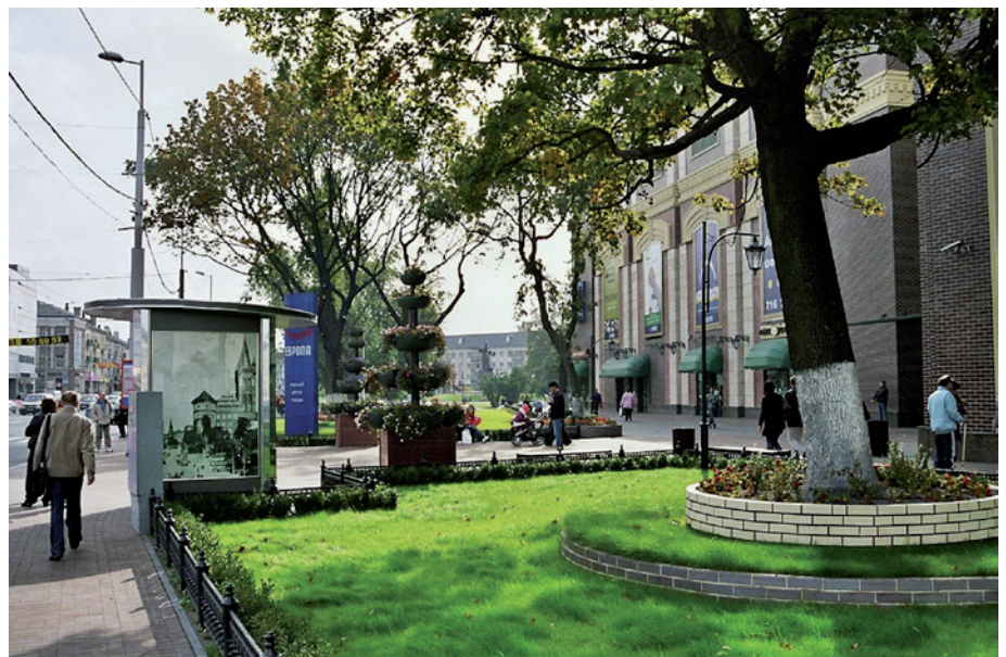
Foto 2: „Königsberg in Kaliningrad“ – historische Stadtsicht von Königsberg

Bei Kaliningrad verhält es sich anders. Der Name Königsberg ist nicht nur deutschsprachig, sondern geht darüber hinaus auf die Burg des Deutschen Ordens zurück, die im Zuge der Eroberung des Baltikums errichtet wurde. Bei der heutigen Bevölkerung herrschen keine Berührungängste mehr mit der früheren Bezeichnung. Das Wort „Königsberg“ und seine umgangssprachliche Kurzform „Kenig“ sind häufig zu hören und auf Werbeplakaten zu lesen. Von offizieller Seite herrscht dagegen weiterhin Zurückhaltung. Die Diskussion um eine mögliche Umbenennung kam in den letzten Jahren aber immer wieder auf. Eine besondere Aktualität erhielt sie bei den Vorbereitungen zum 750-jährigen Jubiläum der Stadt. Man war zwar gewillt, durch aufwändige Feierlichkeiten ihrer Gründung zu gedenken, aber der deutsche Name sollte nach einiger Diskussion auf Beschluss der russischen Regierung schließlich nicht genannt werden (PLATH 2003). Somit entstand der eigentlich widersprüchliche Slogan „750 Jahre Kaliningrad“. Auch das offizielle Logo der Feierlichkeiten ist interessant. Darauf zu