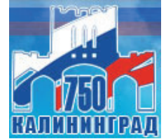
Abb.: Das offizielle Logo zum 750. Jubiläum der Stadt. Es stellt die Umrisse des Königtors dar, angestrichen in den Farben der russischen Flagge.

Umbenennungen abgelegt und ihre alten Bezeichnungen wieder angenommen.