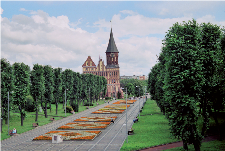
Foto 3: Der Königsberger Dom auf der Pregelinsel 2005 – Symbol für die Verbindung der deutschen Geschichte mit der russischen Gegenwart

wurde der Platz neu gestaltet, gepflastert und mit Laternen und Bänken bestückt; das Lenin-Denkmal wurde versetzt. Bis 2008 wurde eine 25 Meter hohe Säule errichtet, die an den sowjetischen Sieg im