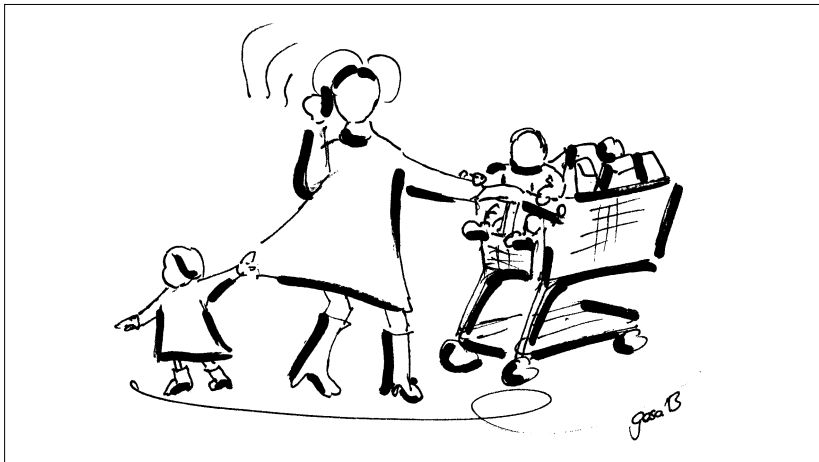
Abbildung 2: Komplexität des Alltags (eigene Darstellung)

Klimaberichterstattung und Aufklärungskampagnen können auch das Gegenteil des erwünschten Verhaltens auslösen, nämlich Gefühle der Überforderung und der Machtlosigkeit. In der Literatur ist die Rede von „Climate Fatigue“ und Umweltängsten (z. B. Kerr 2009). Soziologen und Haushaltswissenschaftler