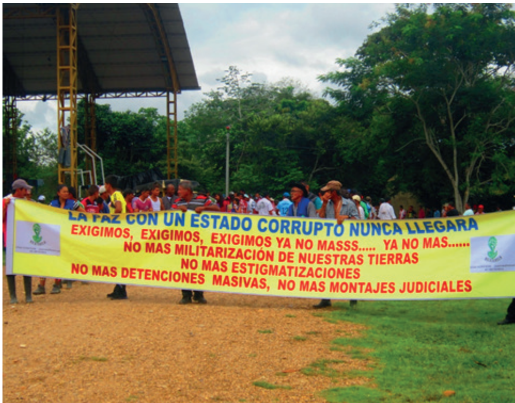
Movilización permanente por los DDHH. La Macarena, Noviembre de 2014

Otros contextos de oportunidad para el uso indirecto de la violencia se establecen a partir de las estrategias de guerra empleadas por la guerrilla frente a las ofensivas de las Fuerzas Militares. El comportamiento de las FARC en el periodo de consolidación del Plan Patriota (que desplegó alrededor de 27.000 hombres en el Caquetá, sur del Meta y Guaviare) y la Política de Defensa y Seguridad Democrática, osciló entre el repliegue táctico y la adopción de la guerra de guerrillas como estrategia de combate (Echandia & Bechara, 2006). Durante este periodo de tiempo, algunas zonas de repliegue consolidadas por las FARC durante el despeje, transitaban lentamente a ser zonas en disputa entre el grupo guerrillero y los