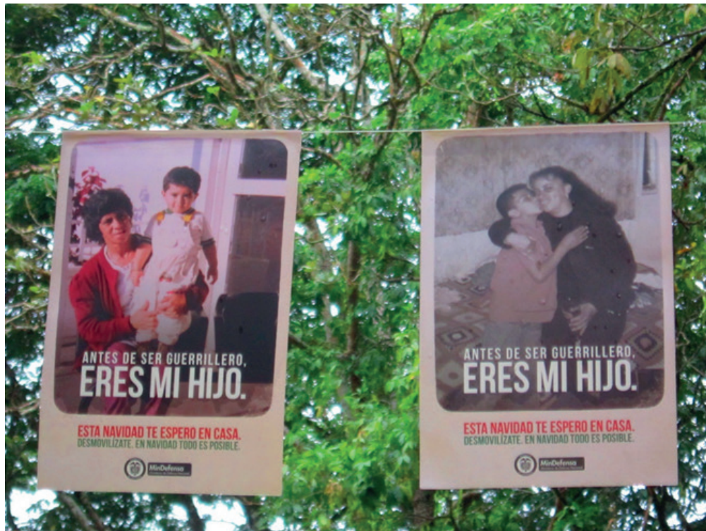
Propaganda oficial del programa de desmovilización. San Vicente del Caguan.

Estos relatos no dan cuenta solo de decisiones subjetivas (desmovilizarse-denunciar) o de quiebres comunitarios (desconfianza y hostilidad entre vecinos) sino de un contexto socio político que plantea a los sujetos una serie de alternativas – violentas- para tramitar sus conflictos o agenciar sus decisiones. Para comprender los escenarios que permiten la victimización horizontal, planteo el concepto de contexto de oportunidad el cual me permite identificar y comprender los múltiples incentivos que desde diversos niveles (internacional, nacional, local) y actores (Fuerzas Militares, Grupos Insurgentes) posibilitan el uso indirecto de la violencia a manos de civiles.