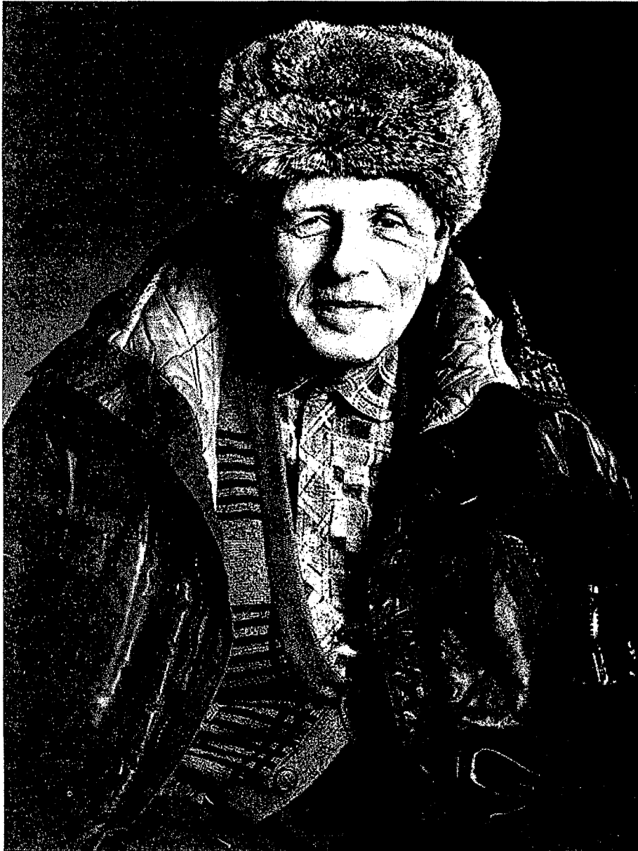
Andrej Sacharow in den 1960er Jahren