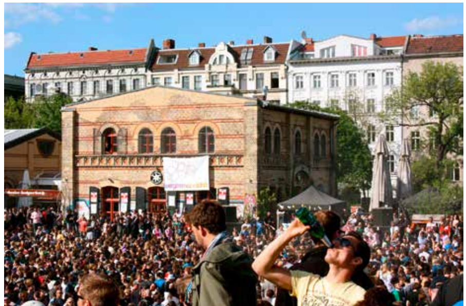
Fotos 1 und 2: Politische Parolen und hedonistischer Habitus (MyFest) (Ilse Helbrecht u. Sebastian Schlüter 2011)

übergangen sind, der Polizei keine erwartete Anzahl an BesucherInnen zu nennen, zeigt die DGB-Demonstration am Vormittag des 1. Mai eine systematische Überschätzung der erwarteten TeilnehmerInnenzahlen. Tabelle 1 verdeutlicht die große Diskrepanz in den BesucherInnenzahlen zwischen den zwei Veranstaltungen.