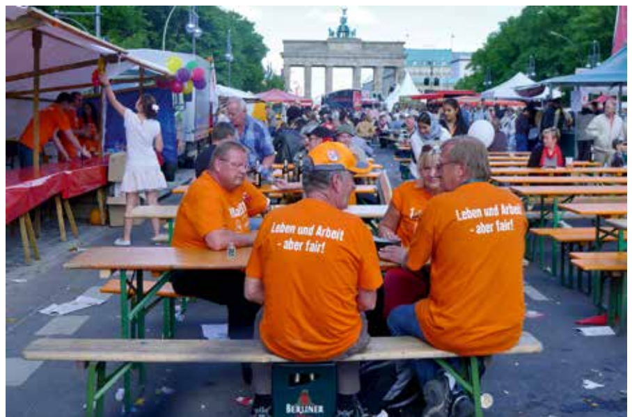
Fotos 3 und 4: Phänomenologie von DGB-Veranstaltung und MyFest