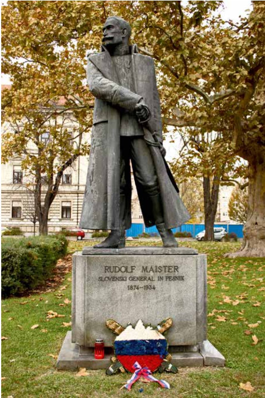
Foto: In Maribor im Jahr 1987 errichtetes Denkmal für Rudolf Maister