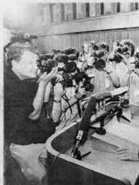
ZGODOVINSKO DEJANJE - Preobčinski slovenski skupštini dr. France Bučar razglasila osnovni povelje Slovenije.