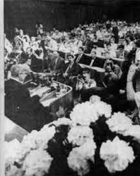
TUDI CVETJE V NACIONALNIH BARVAH - Poslanci v slovenskem parlamentu sprejeli govor predsednika preobčinske od dneva samostojnosti Slovenije Milana Kučana.